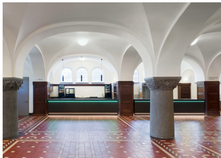
pagelhenn architektinnenarchitekt, Bürgerhaus Langenberg –

WIR MACHEN UNS STARK: FÜR DIE INNEN- ARCHITEKTUR!