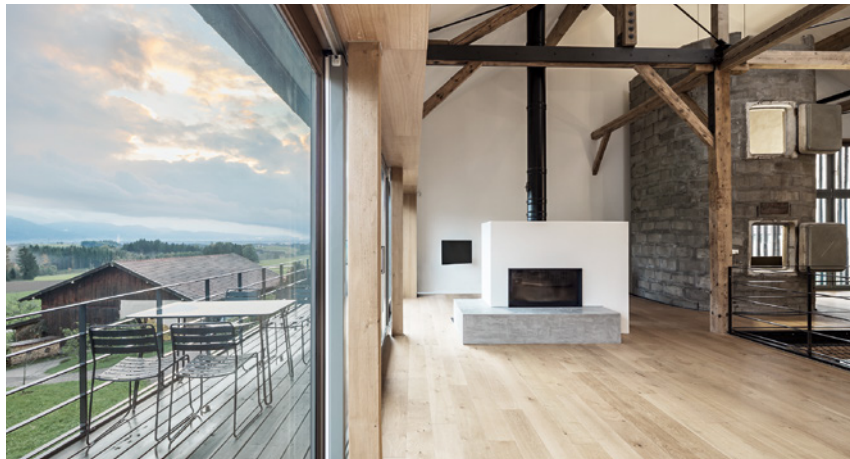
Quest Architekten Innenarchitekten, Umbau Bauernhaus

SIE KÖNNEN DIE RICHTIGEN PARTNER FÜR IHRE BAUAUF- GABE FINDEN. WIR BERATEN SIE GERN.