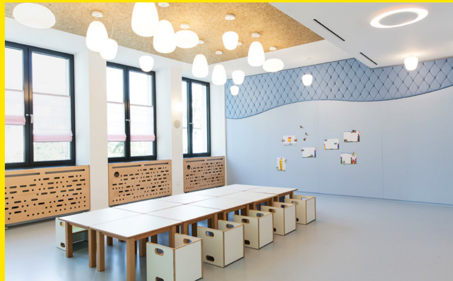
Kandora+Meyer Architekten Innenarchitekten, Kinderclub Westend

RÄUME FÜR MENSCHEN BAUEN: WIR UNTER- STÜTZEN SIE.