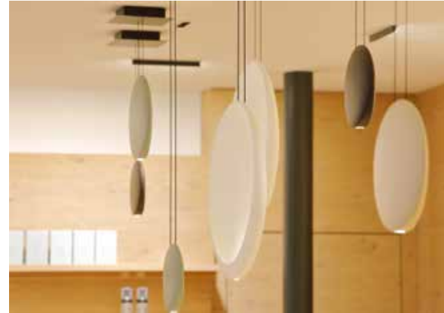
Schon von Weitem sieht man die tanzenden Pendelleuchten über dem Tresen.