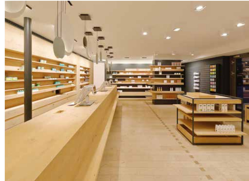
Die Reliefstruktur der Regale optimiert die Warenpräsentation.