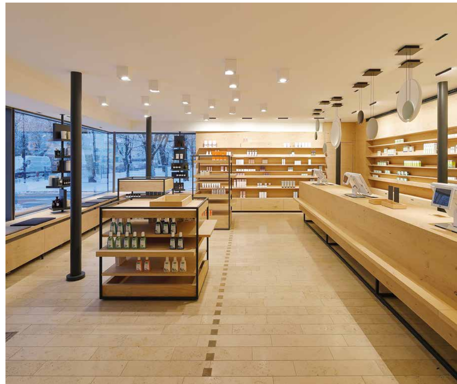
Die warmtonigen Materialien stammen aus dem Umland.

The clear formal design and the choice of materials form the backbone of the concept. Following the traditions of the rural location, the reduced design of the local materials is still very much in keeping with our times.