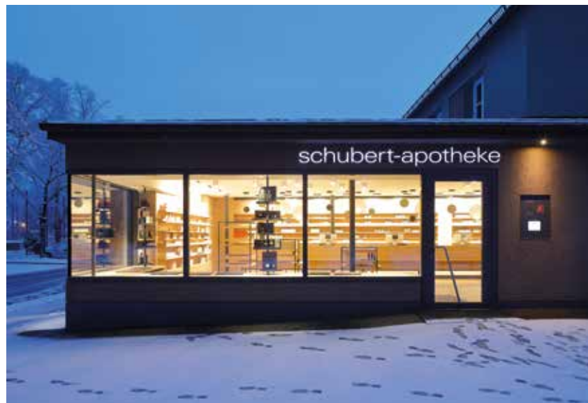
Das Licht bildet den Raum.