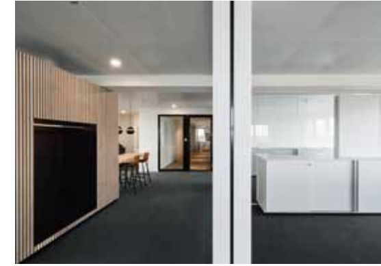
Raumteiler Garderoben und Akustikwände