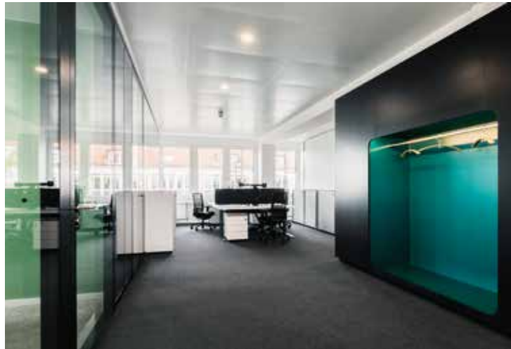
Raumteiler Garderoben und Akustikwände