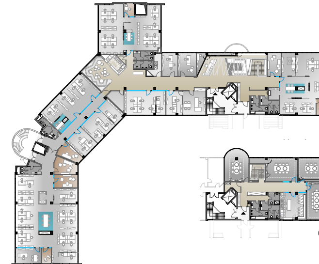
– Grundrisse 2. und 3. OG