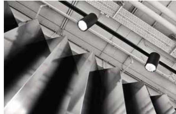
Die vertikale Faltung der Präsentationsmöbel sorgt für spannende optische Effekte.