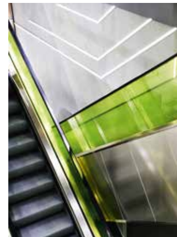
Die Lichtgestaltung dient der Strukturierung sowie der Kundenführung.