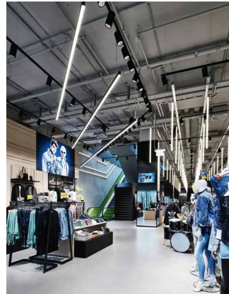
Eine moderne und industrielle Anmutung mit hohen Decken kennzeichnet den Store.