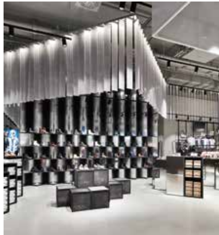
Das Schuhangebot wird durch auffällige Highlightwände effektiv präsentiert.