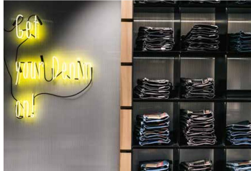
Das klare Designkonzept inszeniert die große Jeansauswahl optimal.