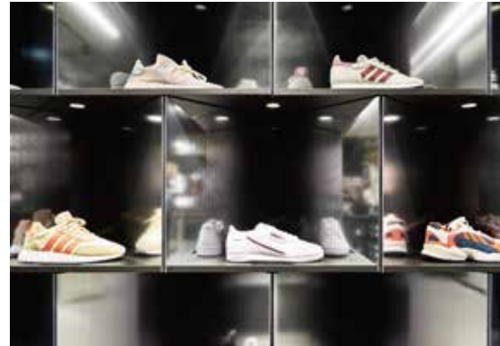
Einzelne Schuhe sind in spiegelnden Nischen platziert.