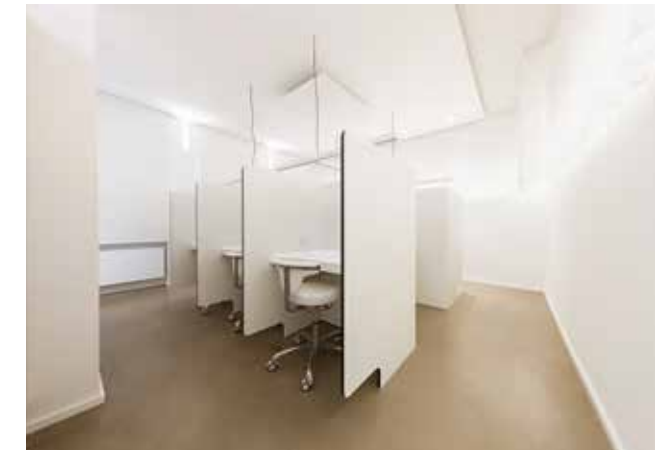
— Sensorikprüfplätze nach DIN EN ISO 8589