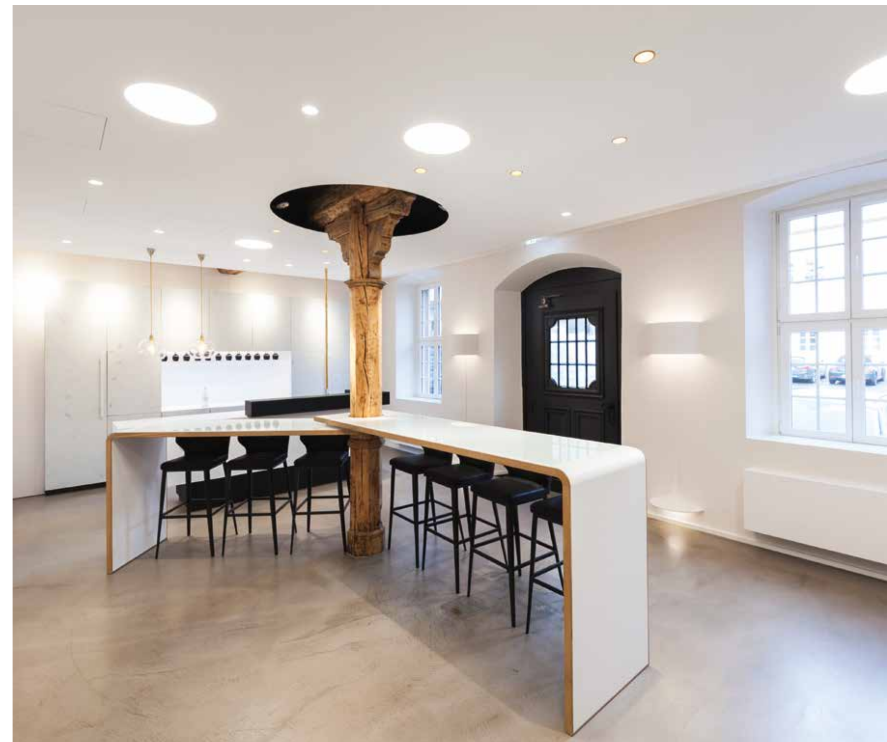
! Drehbare Besprechungstheke

Our interior concept for the RKM Sensory Analysis Room is designed to sensitively and quietly blend in with the historical building fabric and to help the building develop a new identity. A clearly structured design vocabulary and a coordinated lighting architecture sensitise users and visitors.