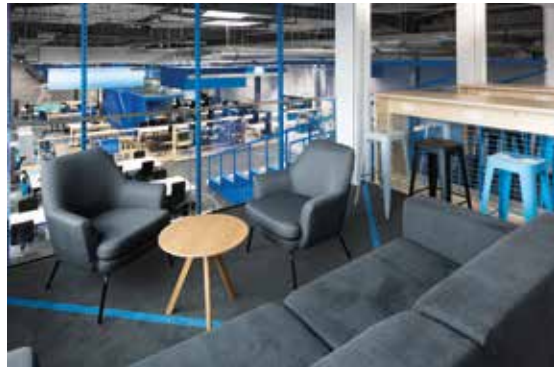
Lounge mit Ausblick —