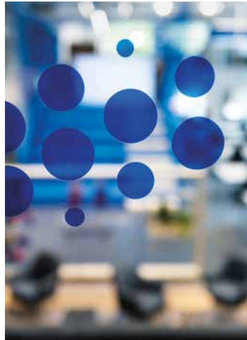
Graphics — BlueCube