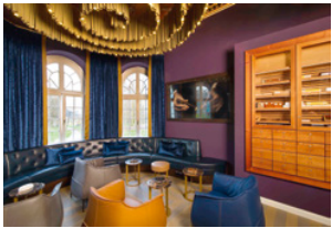
| Smokers Lounge