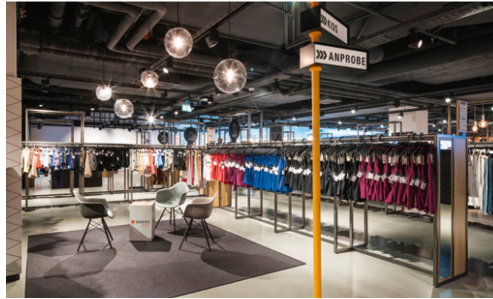
l Zalando_Outletstore