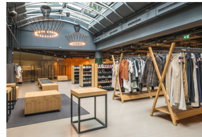
Premiumbereich mit Kronleuchtern