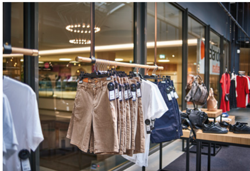
Details Premiumbereich