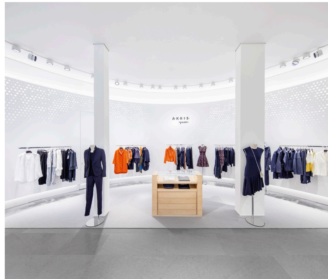
1 Boutique Punto

It was only a matter of time for the gallery presentation format to also reach the fashion sector. AKRIS, a Swiss fashion label, used the aesthetic parameters of modern exhibition design to equip its new boutique in Düsseldorf.