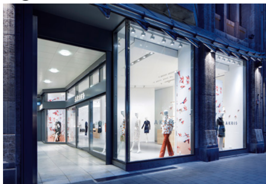
1 Eingang und Schaufenster