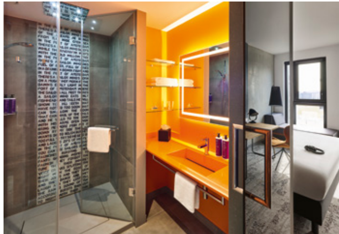
Power Shower – „In the Port of Amsterdam, there's a sailor who dances ...“