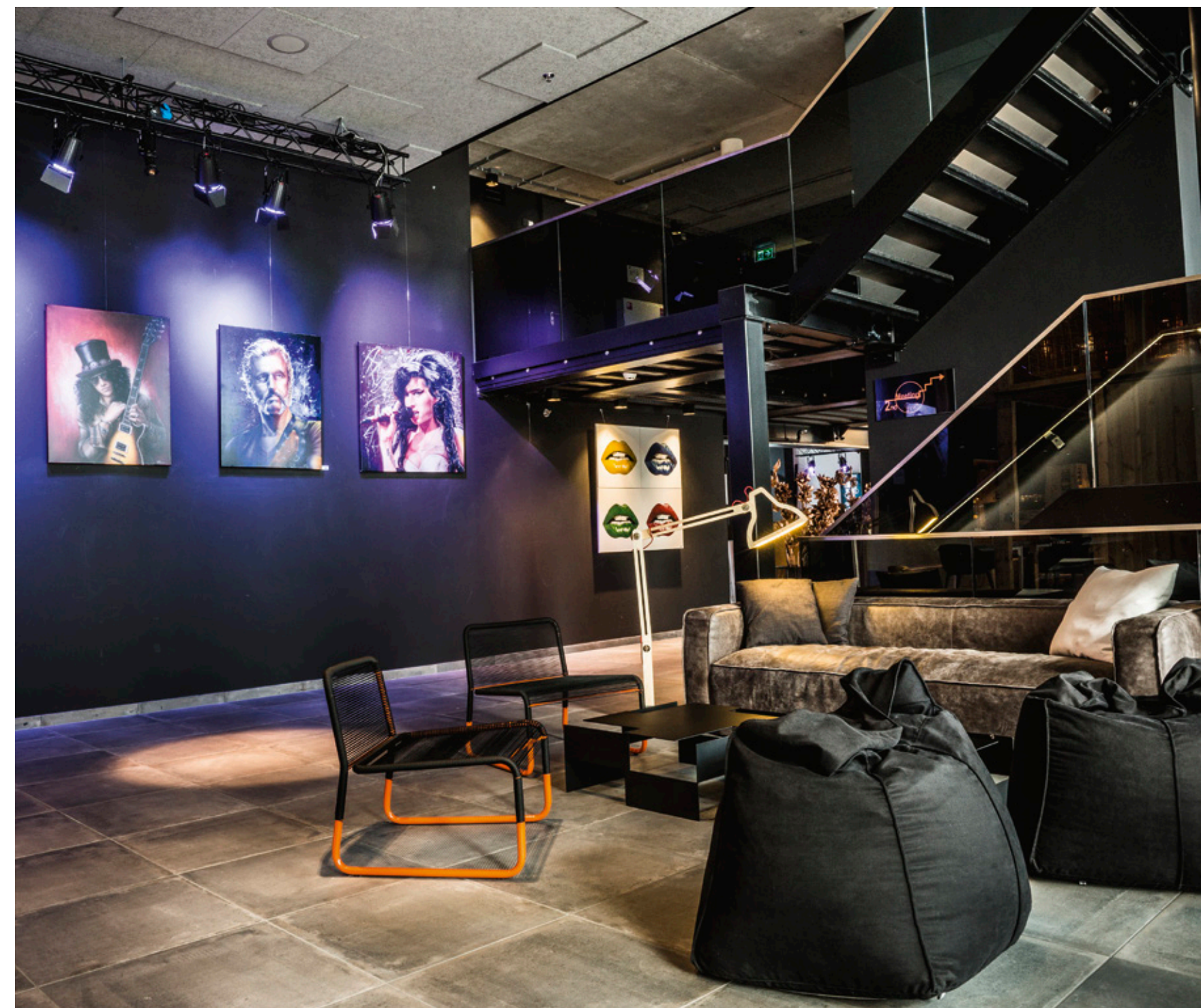
Art Lobby: Lounge & Art – wechselnde Ausstellungen lokaler Künstler

Jaz is music – with light, material and passion we have composed the design soundtrack. Music is tangible anywhere, either as mega equalizer on the ceiling or as applauding audience on the corridor walls. Graffiti & Oranje highlights provide for the “local spirit”.