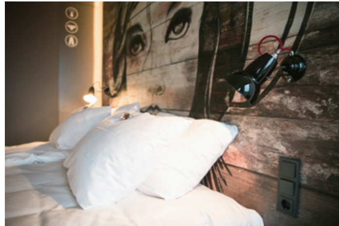
Chill out Area – Holz trifft dreamy Manga-Original-Motiv aus Amsterdamer Sprayer-Szene.