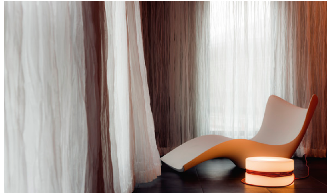
Wellness – wird im Jaz zum Wellbeing.

Jaz is music – illuminiertes Klangband an der Decke führt zu den Suiten.