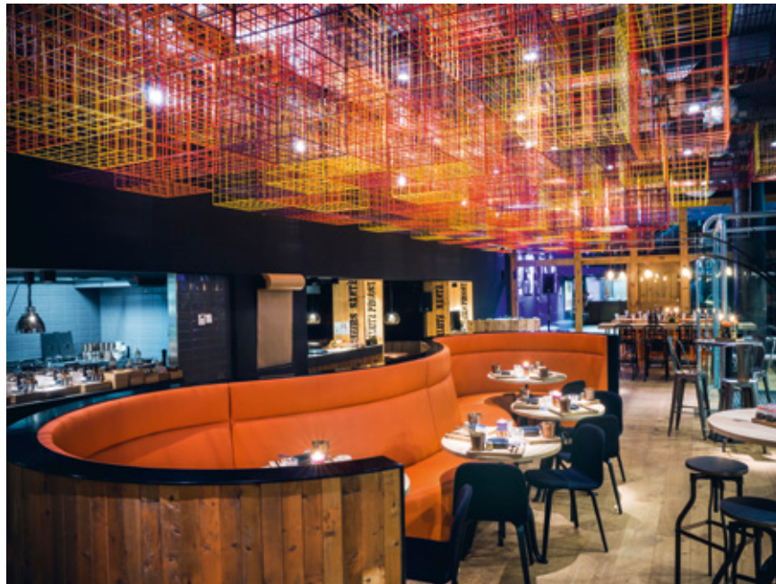
44 Das modulare Gastro-Konzept macht Gäste glücklich und die Jaz-Macher flexibel. —