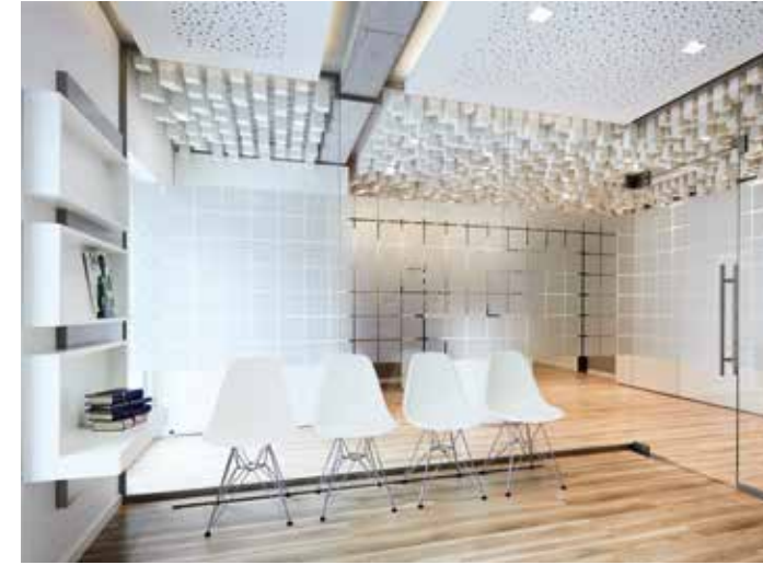
Schnörkellose Geradlinigkeit auch im Wartezimmer