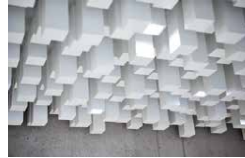
Die außergewöhnliche Deckengestaltung als prägendes Gestaltungselement