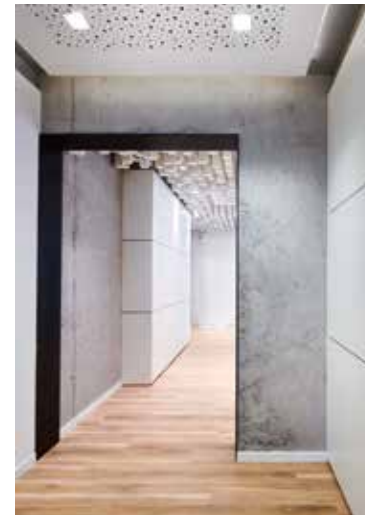
Wirkung durch farbige Betonung