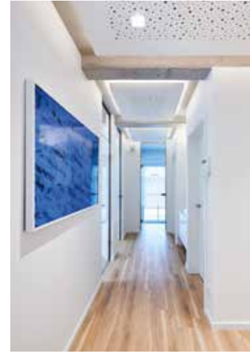
Helle und freundliche Gestaltung der Flurbereiche