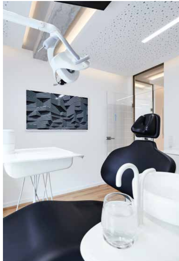
Identische Formensprache auch in den Behandlungszimmern