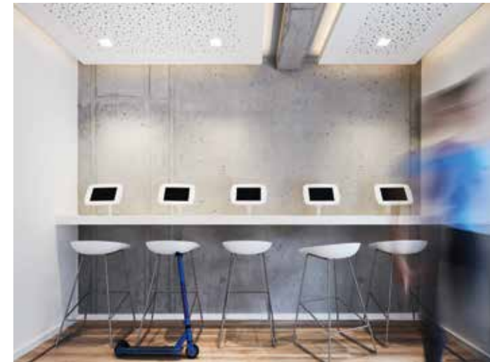
Abgegriffene Zeitschriften im Wartezimmer sind Schnee von vorgestern! Grundriss