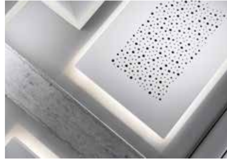
Optische Betonung der Akustikelemente durch indirekte Beleuchtung

„Facettenreiche Innenarchitektur macht diese Praxis zum spannenden Erlebnis!“