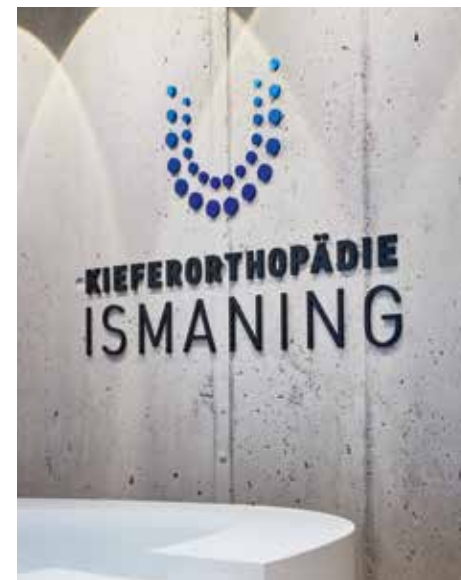
Stylische Optik – sehr modern, aber nicht modisch

handlungszimmer. Im 1. OG befinden sich Mitarbeiterbereich, Verwaltung, Arztbüro und Zahntechnik. So konzentriert sich das EG auf die Patienten, während der Mitarbeiter- und Arbeitsbereich bewusst separiert ist. Der Empfang erhielt einen „Himmel“ aus weißen Quadrern, die neben der extravaganen Optik auch der Akustik im Raum dienen und zudem Teile der Beleuchtung beinhalten. Die restlichen Deckenflächen wurden als Akustikflächen abgehängt und mit umlaufenden Lichtvouten versehen, einzelne Spots setzen Akzente an den Wänden. Glas und große Fenster sorgen für Transparenz und Helligkeit, die Holzoptik des