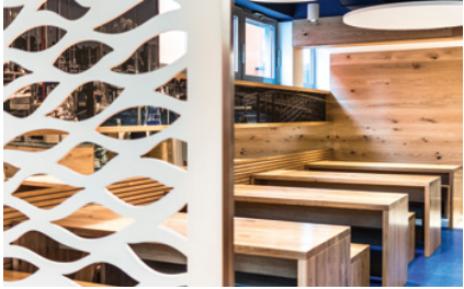
Sitzmöglichkeiten Speiseraum 2 als Veranstaltungsbereich nutzbar