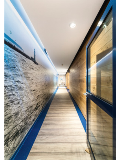
Zugang zum Restaurant