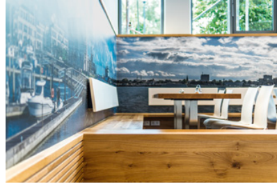
Detail Speiseraum 2