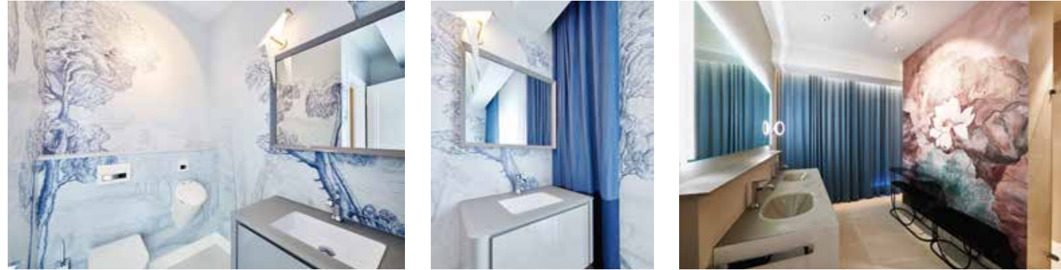
Florale Muster schaffen eine wohnliche Stimmung im Masterbad.

Das Gäste-WC wird durch eine umlaufende Bildtapete inszeniert.