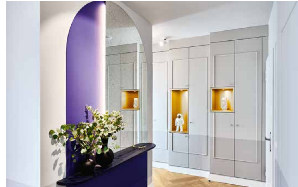
Die gestufte Garderobe und der Spiegel in Portalform bilden das Entree.