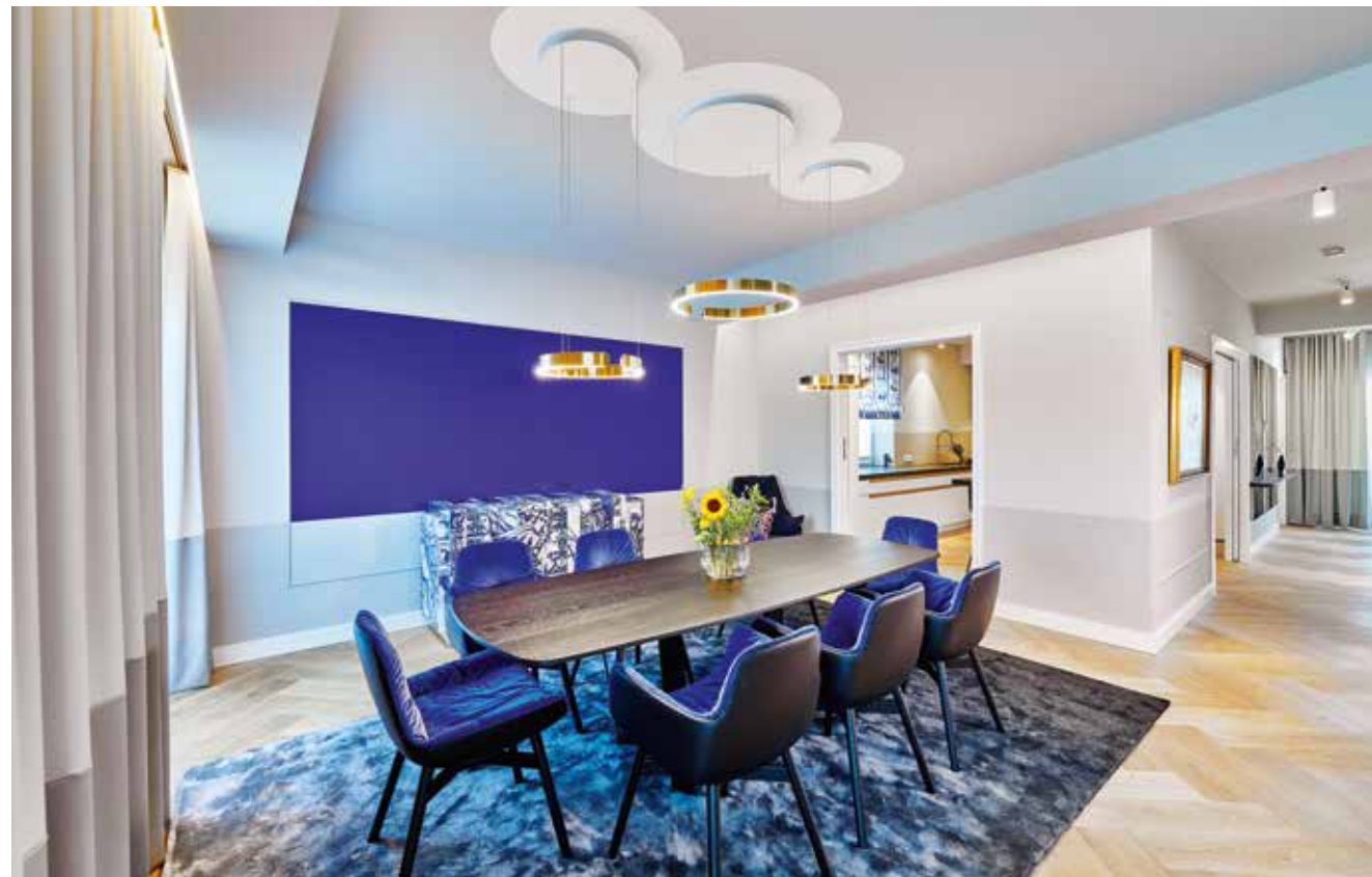
Harmonische Farbgestaltung im Essbereich