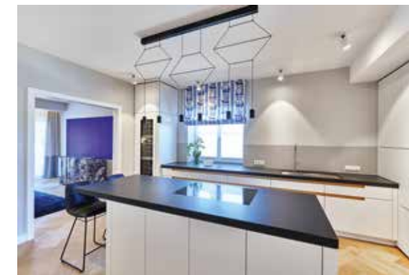
Fortlaufende Farbgestaltung in Küche und Essbereich