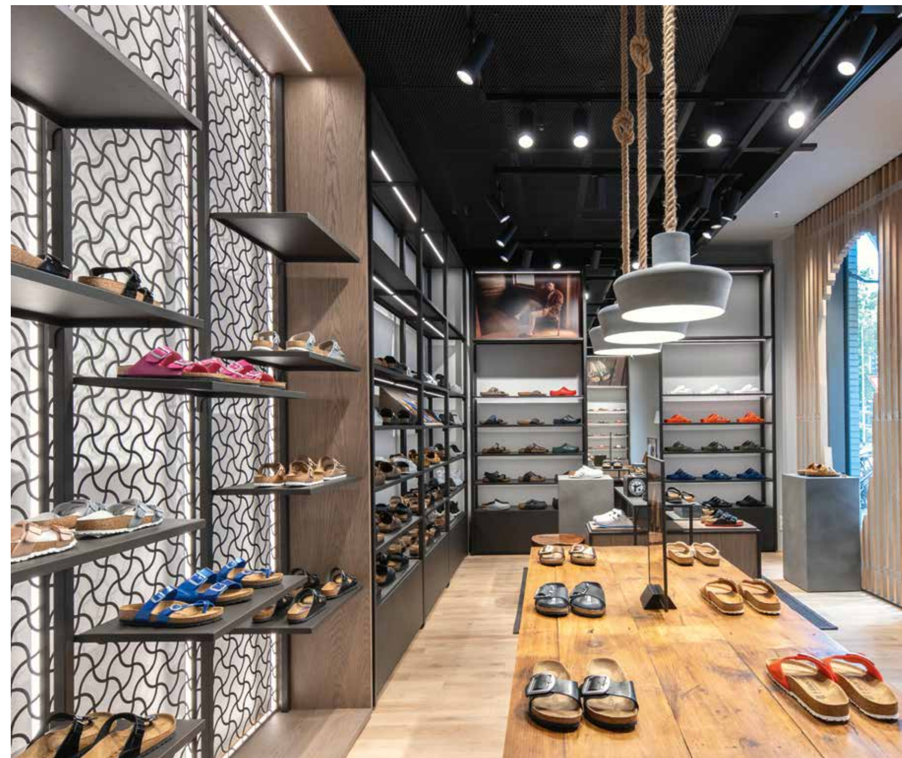
↑ Blick in die Herrenabteilung im hinteren Bereich

Birkenstock is known to be associated with craftsmanship, quality, natural materials and comfort for the users. Similarly, the design was developed to meet the expectations of both 'client and user' at the same time and making shopping an experience.