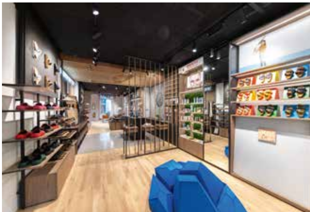
! Hinterer Bereich – Kinderabteilung