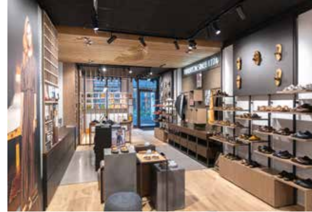
! Zentraler Bereich – Übergangzone