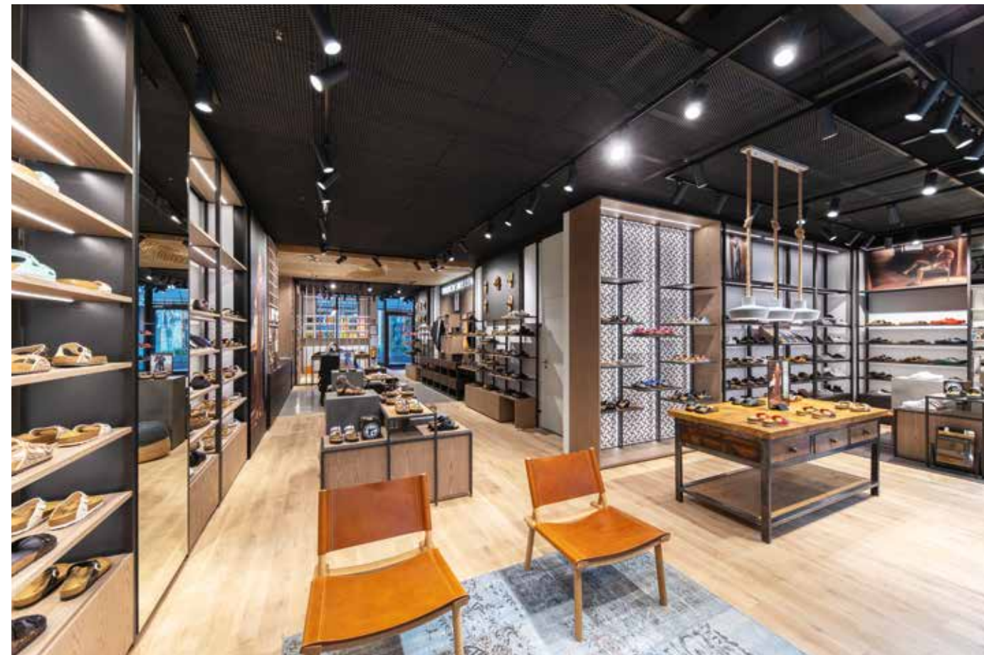
! Vorderer Verkaufsbereich mit Damenabteilung