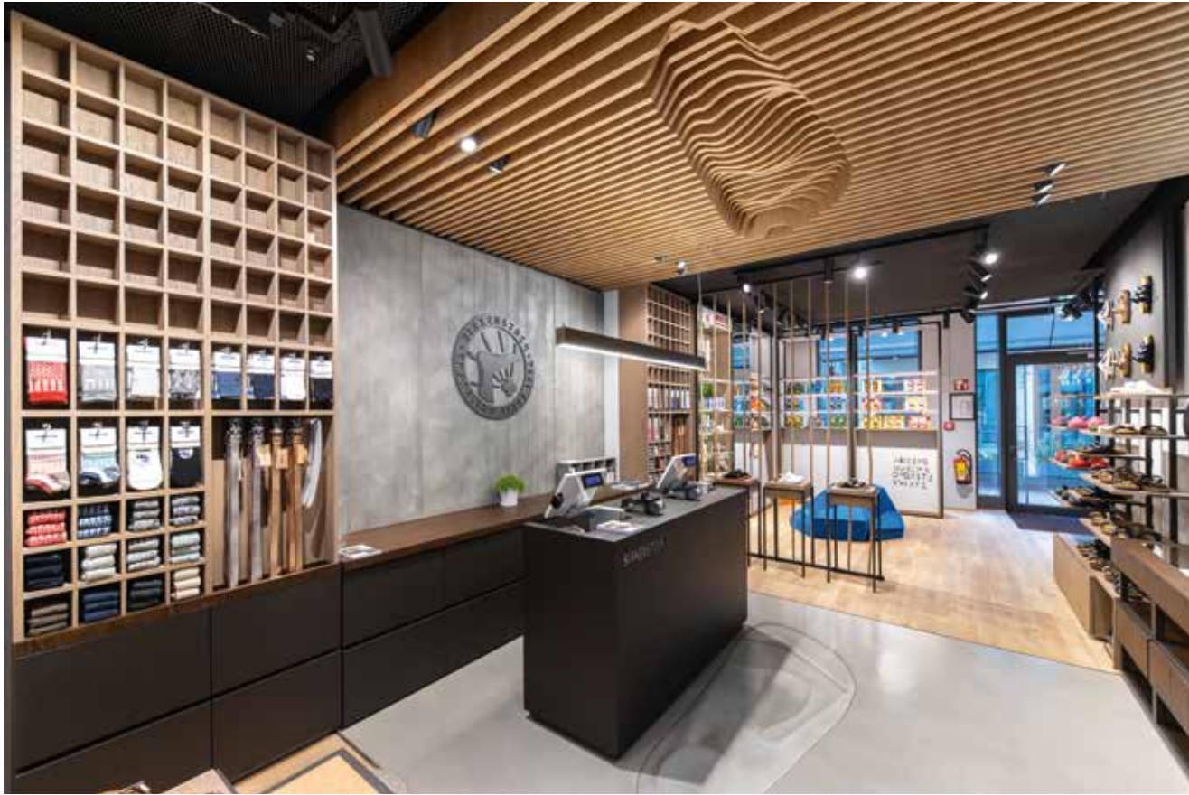
! Zentraler Bereich mit Kassentisch