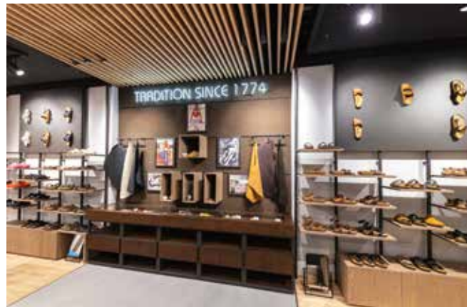
! Birkenstock Heritage Wall