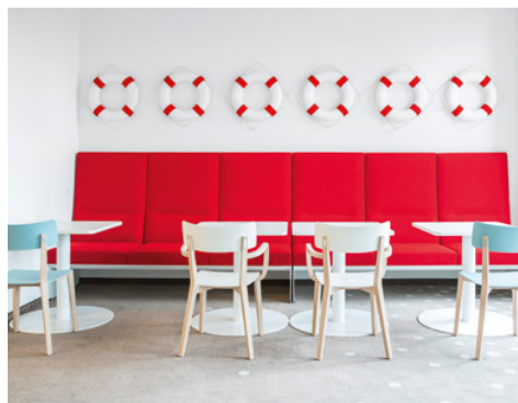
! Sitzbank in der Lunchbox