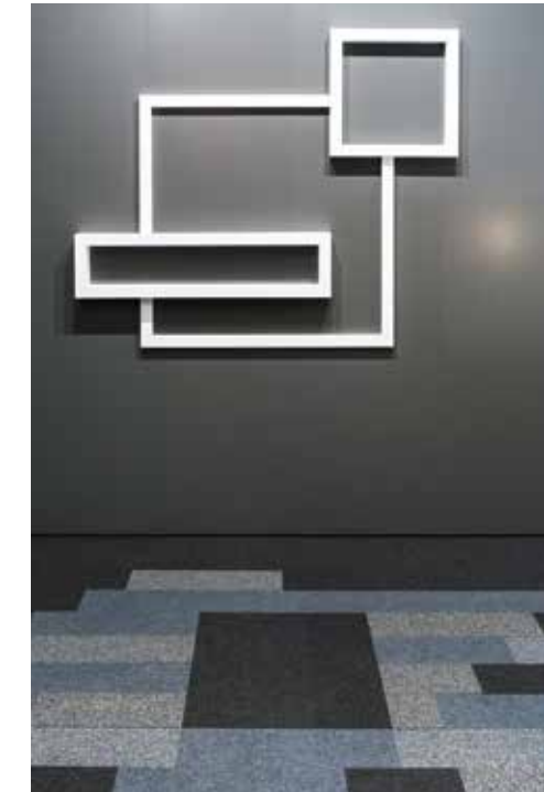
| „Core Modular“ – Formatmix der Teppichfliesen