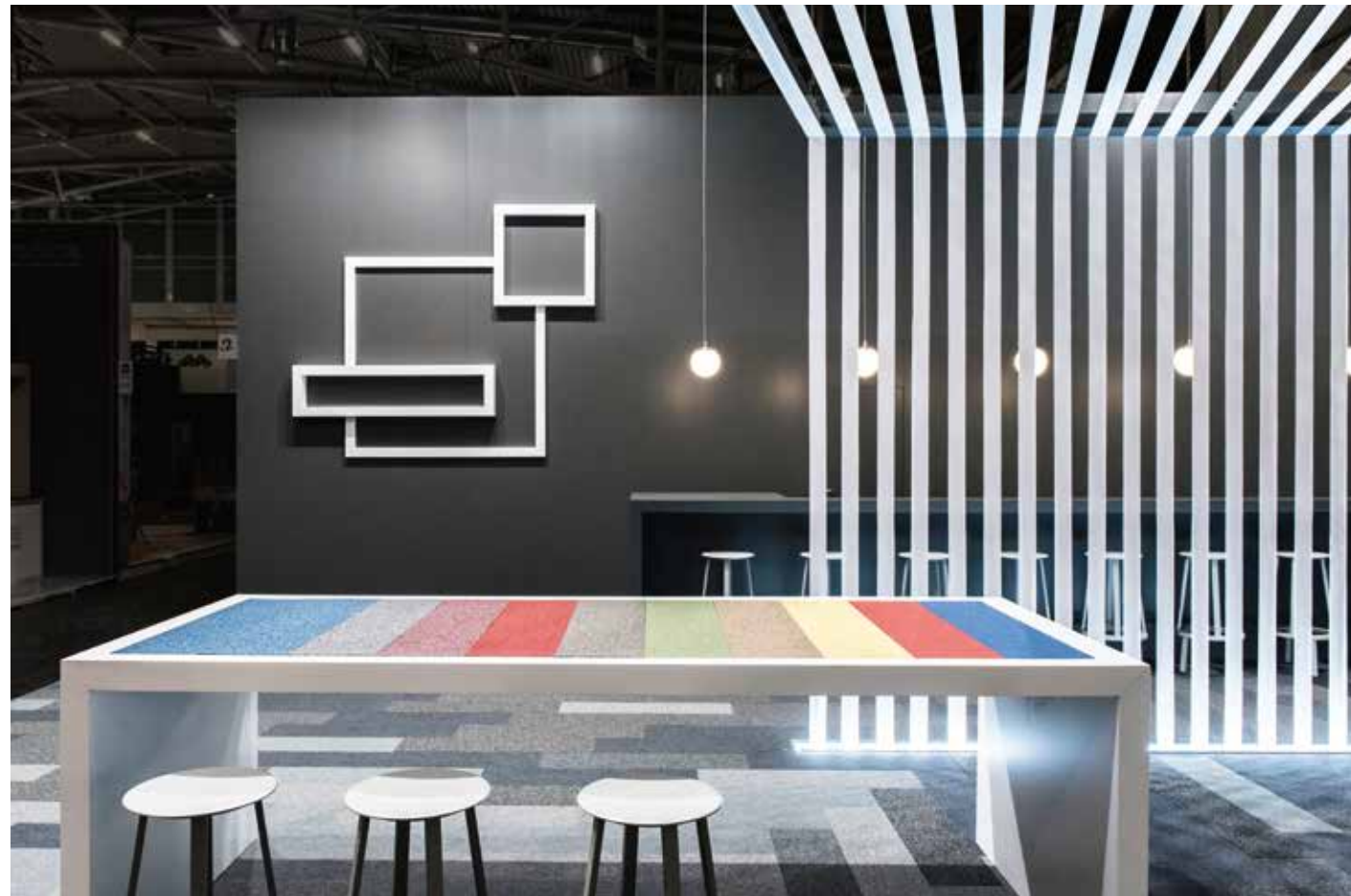
62 | Verlegetisch mit Farbcode