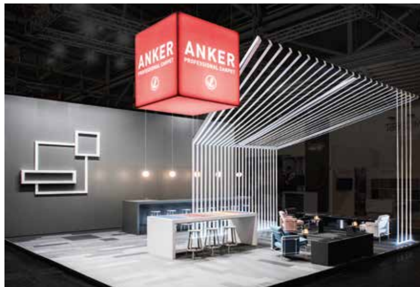
1 Anker erzählt die Geschichte der Teppichweberei.