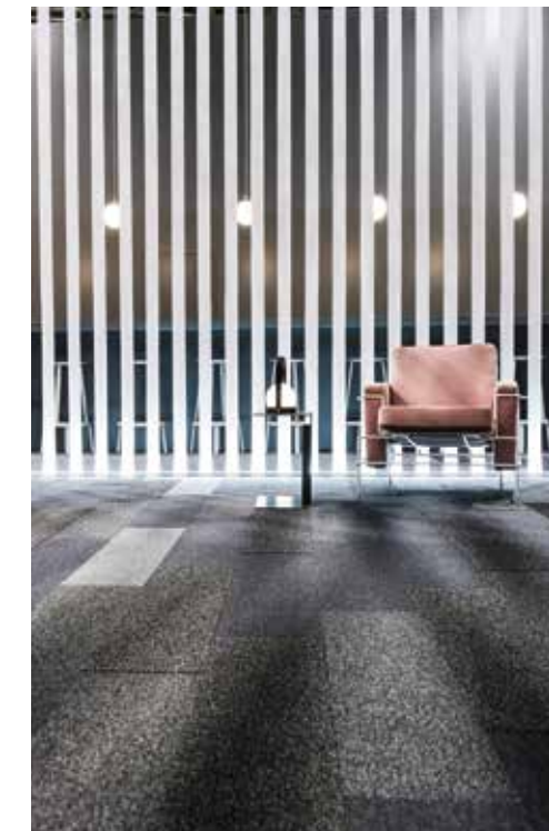
| Straight modern