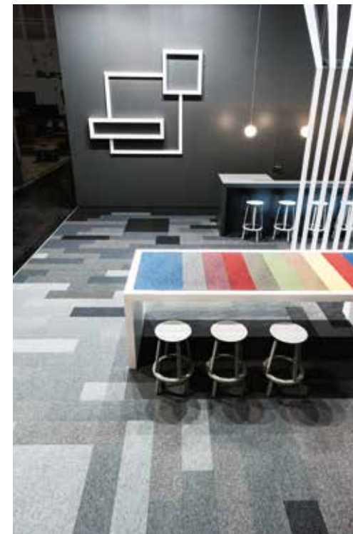
| Boden als individuelles Gestaltungstool