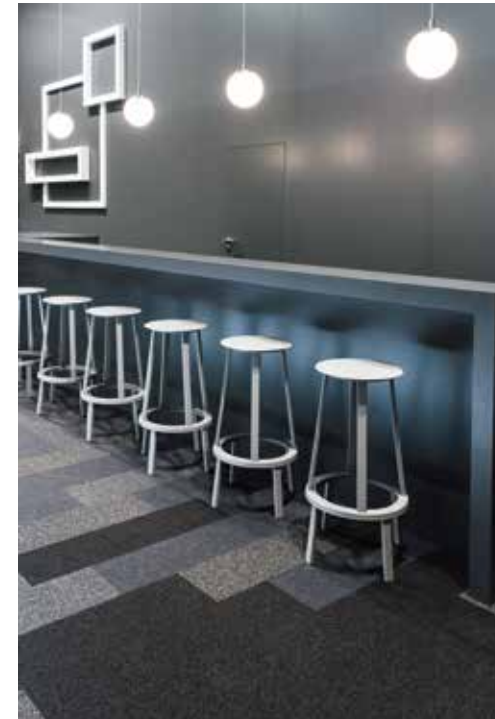
| Elegante Grau- und Schwarztöne im Mix