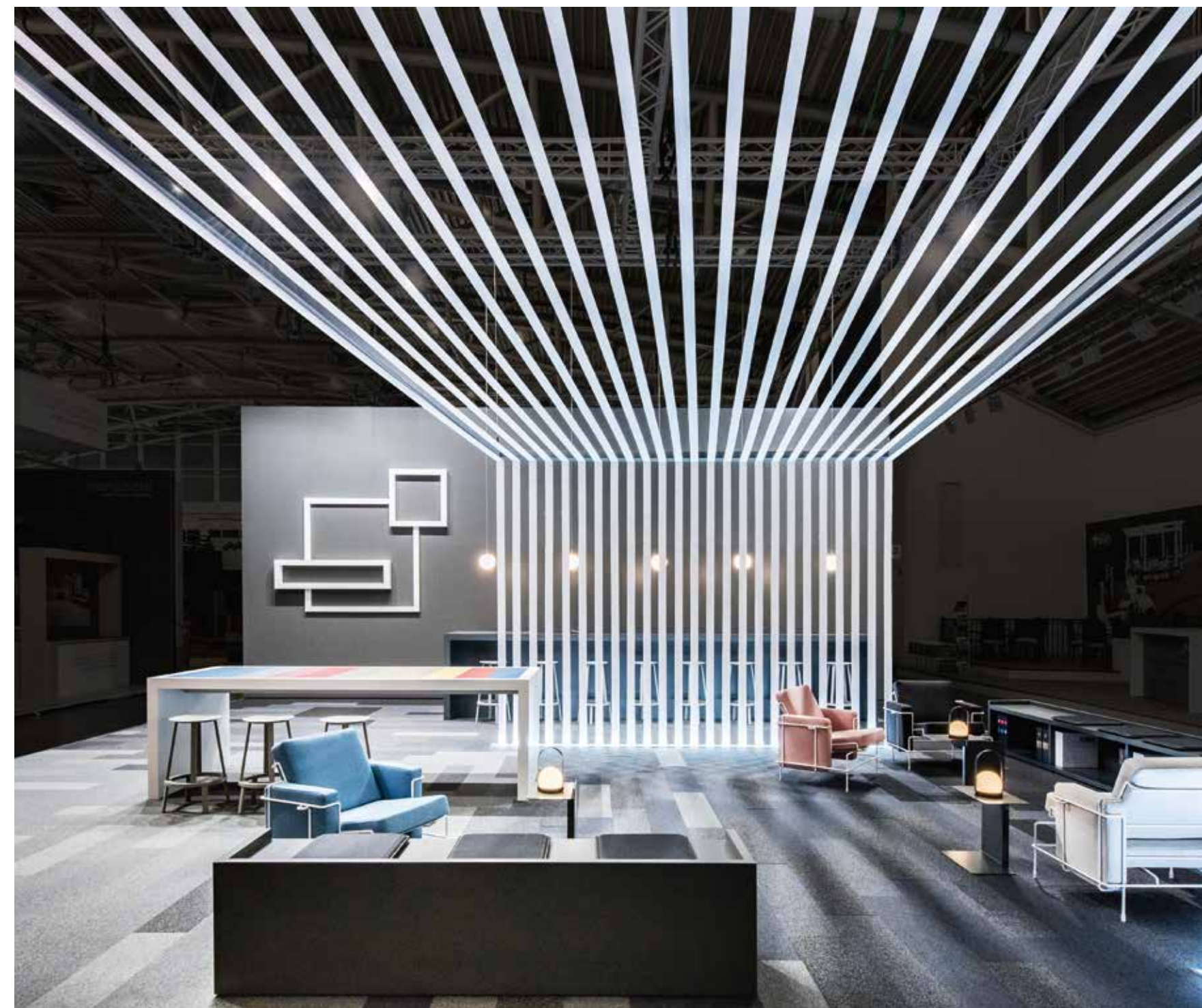
1 loom in a room – der Webstuhl als Symbol

Here Anker tells two stories: that of a German carpet weaving tradition in the form of the symbolic loom and that of Core Modular, a new format mix of carpet tiles. Proven products with a modern look that give designers plenty of creative scope!