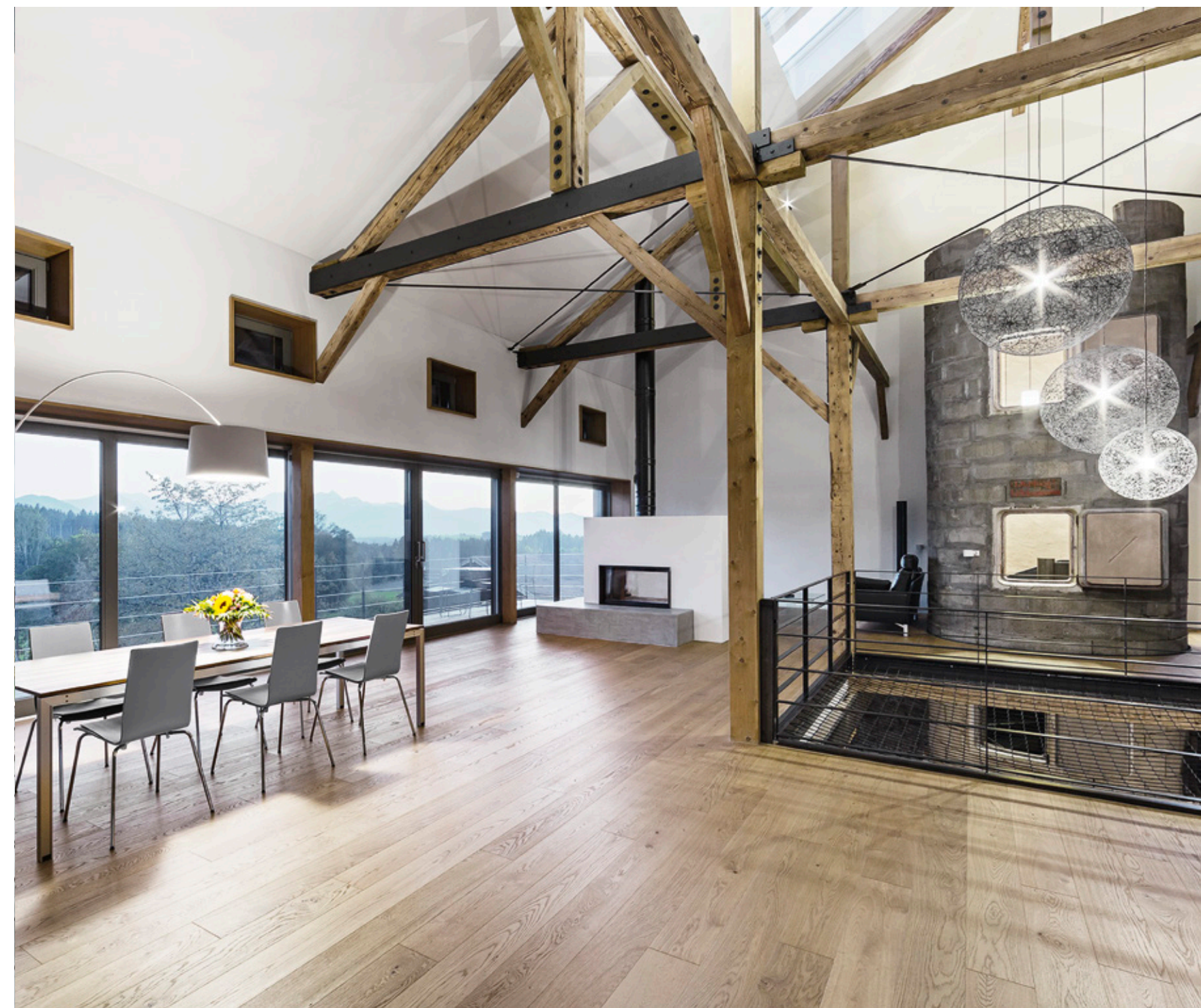
! Offener Wohnbereich – Balkon Südseite

Where hay was once stored, tractors were parked and livestock was kept, a family now lives and works. Carefully and yet self-consciously the barn floor of a former farm located close to Rosenheim was converted into a bright and generous residential loft, while the cowshed with a vaulted ceiling was turned into a small doctor's surgery.