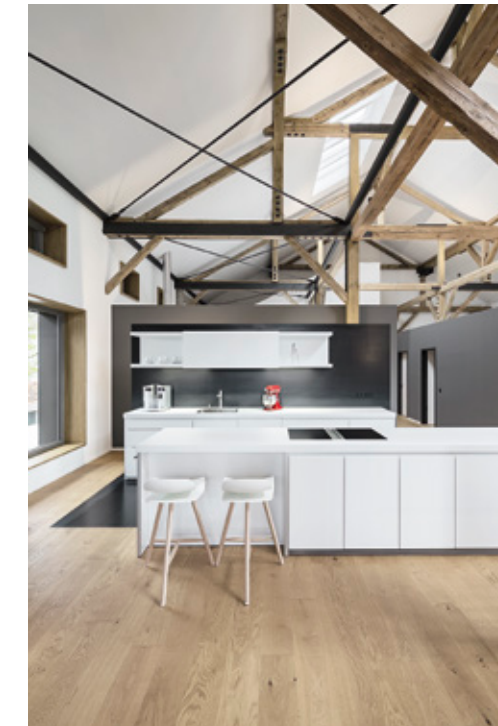
Blick auf den offenen Küchenbereich