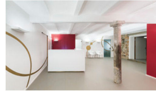
Praxis im ehemaligen Kuhstall – Empfang