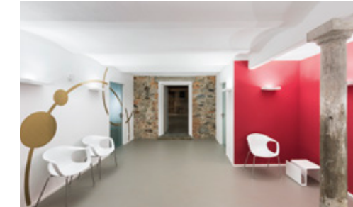
Praxis im ehemaligen Kuhstall – Wartebereich