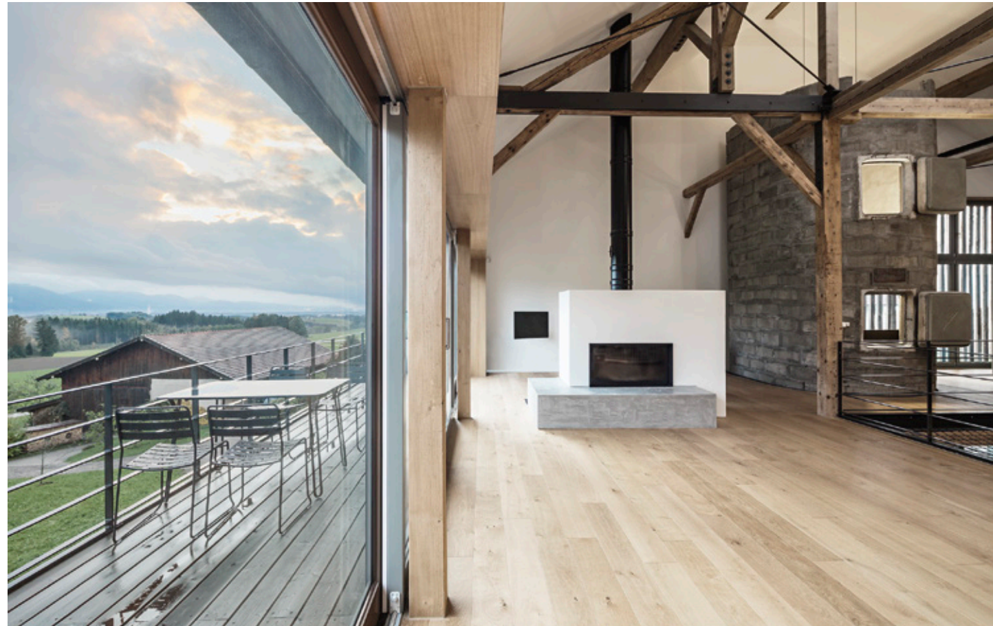
Offener Wohnbereich – Ausblick nach Süden