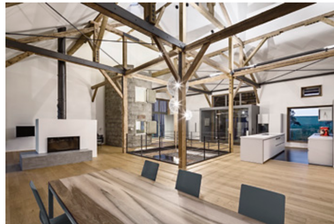
Offener Wohnraum – Blick zum Eingang Nordseite