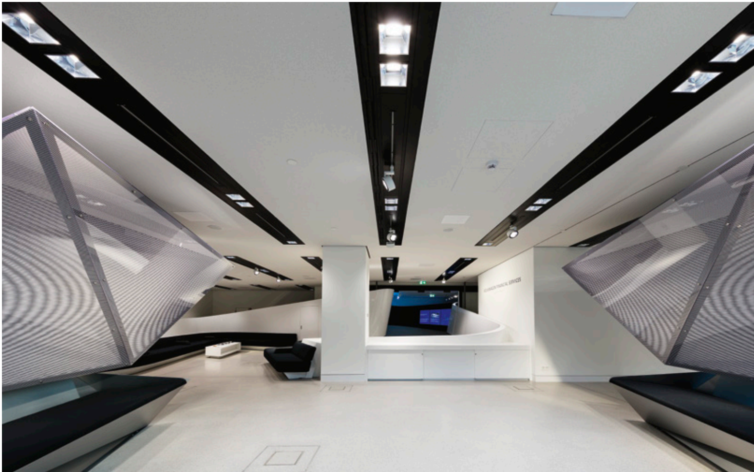
l Präsentationsbereich der VW-Financial-Services mit multifunktionalem Deckenpaneel