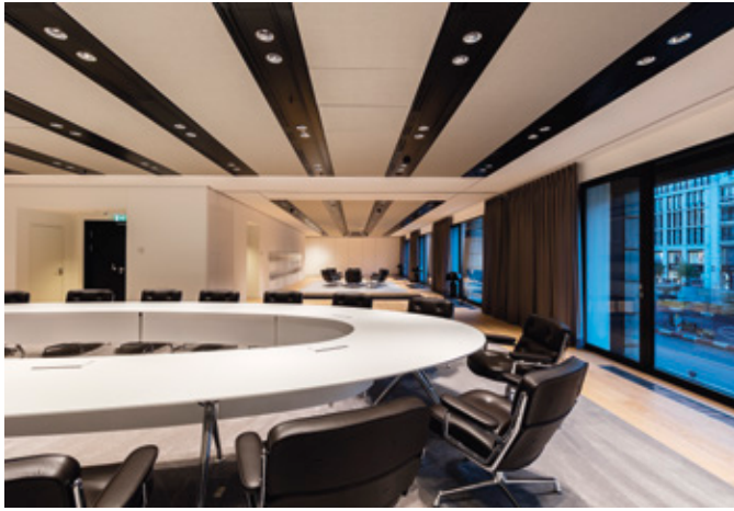
l Multimedialer Konferenzbereich