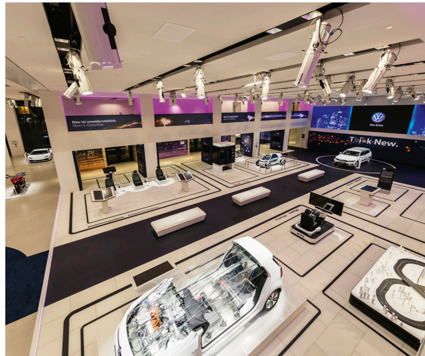
↑ Blick in den zentralen Präsentationsbereich, mit Komponenten der Präsentationsbeleuchtung

The Volkswagen Group Forum DRIVE in the centre of Berlin presents all car makes belonging to the group to the public. Restaurant and shop areas as well as the central, two-storey exhibition space provide a contemporary framework for the imparting of technology, communication and product presentation.