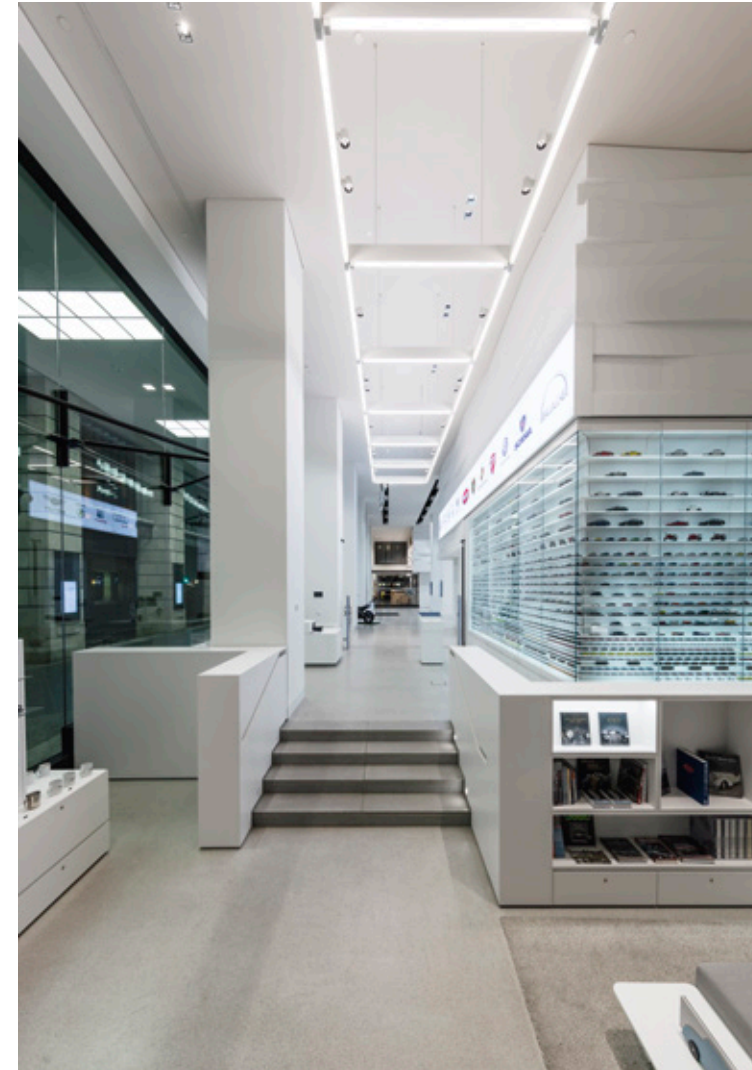
– Shop-Bereich mit Leuchten-Sonderkonstruktion