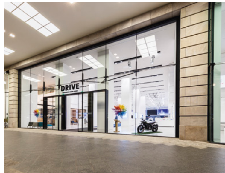
↑ Haupteingang zum VW-Konzernforum DRIVE Berlin, Friedrichstraße