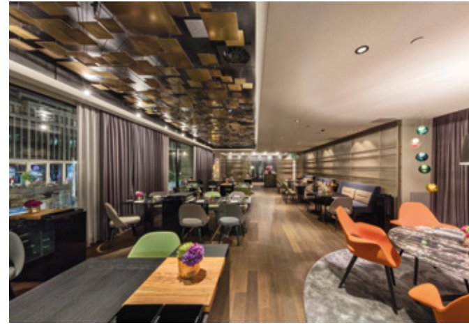
l Restaurant Fine Dining