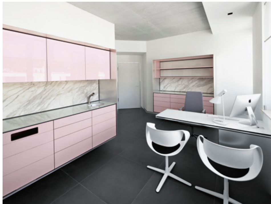
Sprechzimmer | Klarheit, Offenheit und Transparenz