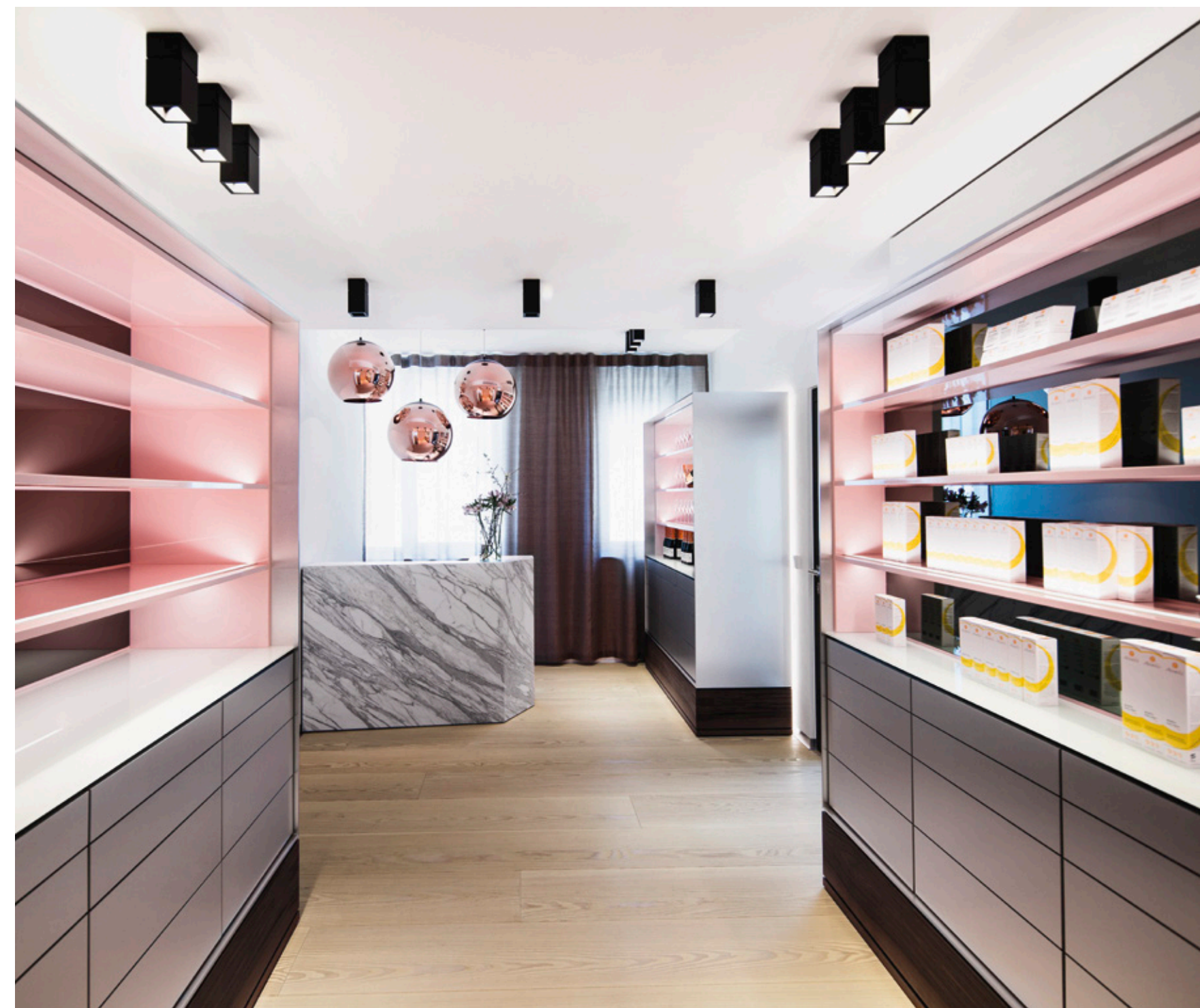
Verkaufsraum | Das Produkt steht im Zentrum.

The three-dimensional marketing design approach mainly focused on functional aspects and the brand message as well as on a formative connection to the specialist field of “skin”. The central theme was interpreted both haptically and visually in a demanding way.