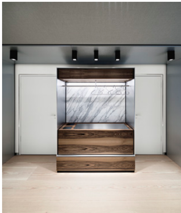
Garderobe | aufgeräumt und klar