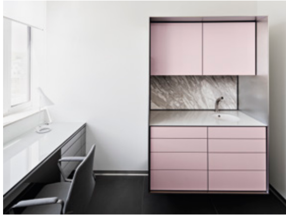
Systemmöbel | klare Linien