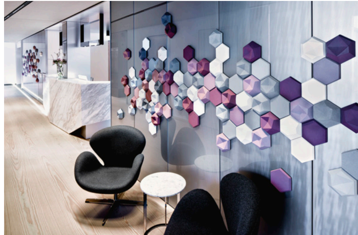
Wandgestaltung | abstrakte Interpretation zur Textur Haut