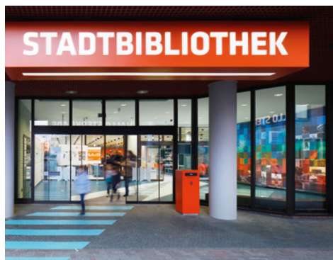
Fassade, Zugang außen