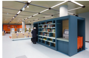
– Servicebereich, Verbuchung