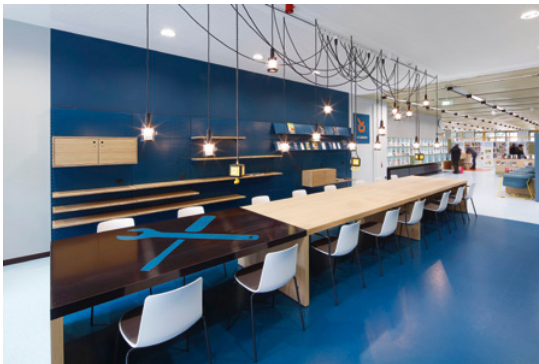
Café LeseWerk, Repair-Café