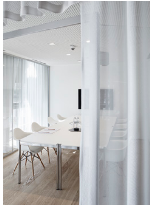
Semitransparenter Besprecher mit Blick zur Baustelle