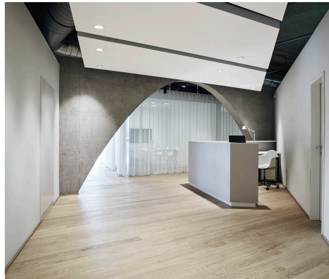
↑ Empfang vor dem Durchgangsbogen

A showroom for the sale of properties was built directly on the construction site. The façade also dominated the interior and therefore the concrete arches were juxtaposed with polygonal elements with textile walls. The spatial tension results from both components.