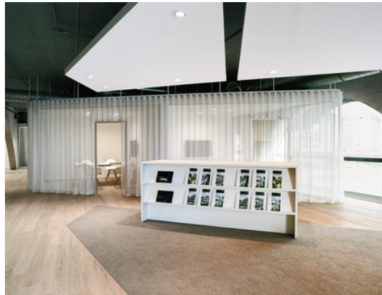
Offener Grundriss mit Infocounter —