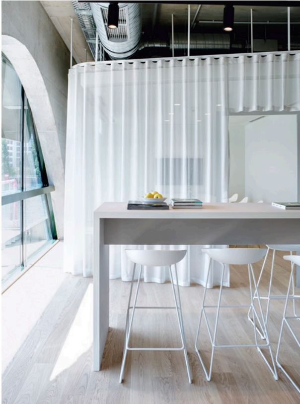
Meeting mit Ausblick