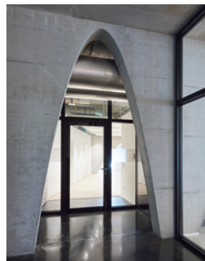
↑ Zutritt zum Showroom