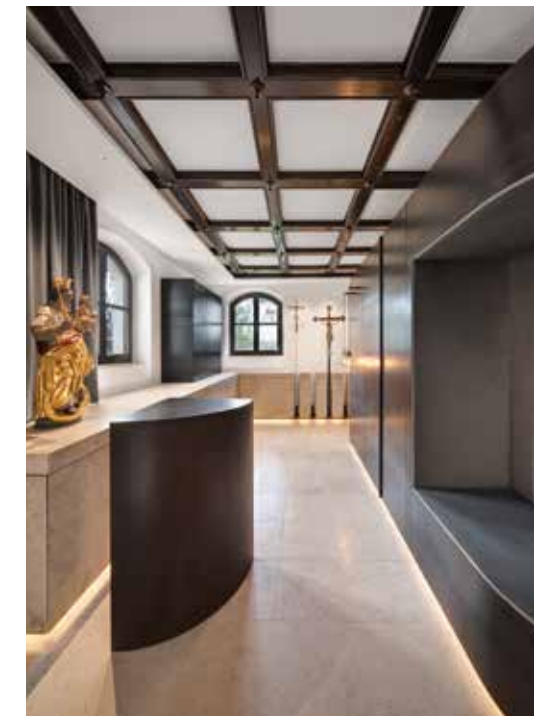
| Tresen, Sitzbank und Garderobe für Besucher