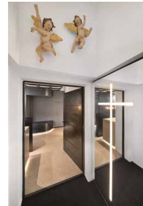
| Putten im Windfang