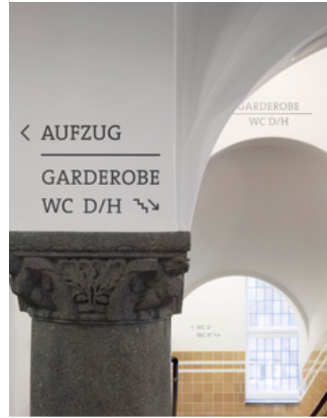
Wandbeschriftung Foyer – traditionelles Malerhandwerk