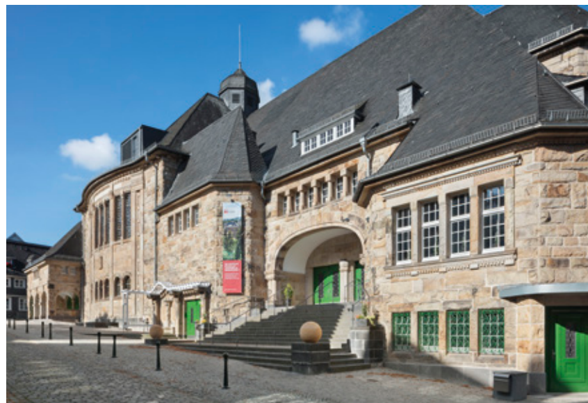
↑ Gesamtaufnahme außen