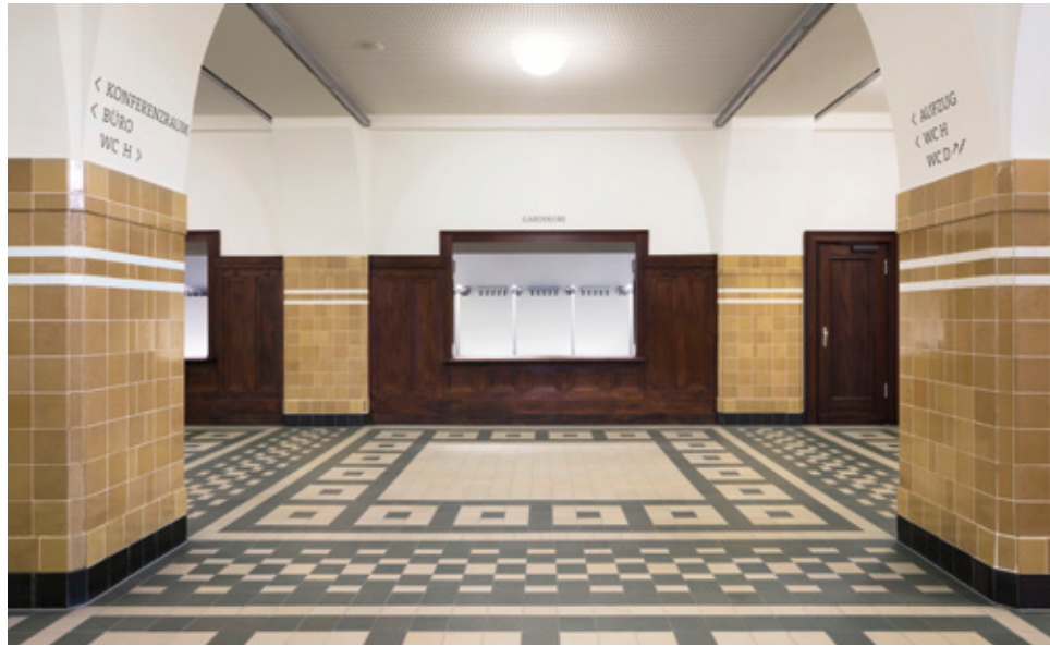
Wandbeschriftung Garderobe – Orientierung ohne Schilder