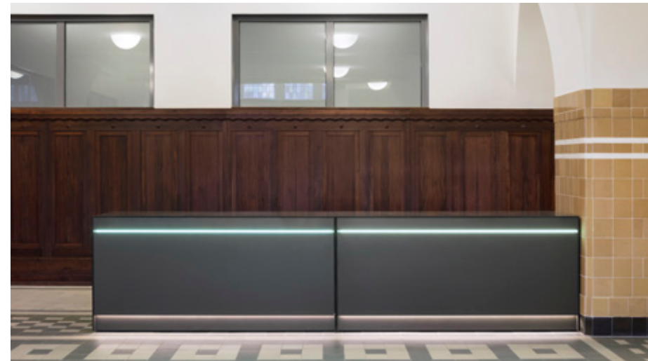
Theke UG – mobiler Einsatz der Elemente im Gebäude