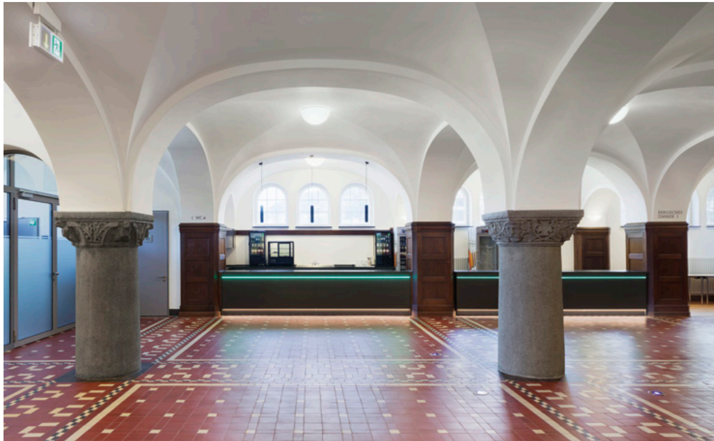
60 Theken im Foyer – illuminierter Kontrast