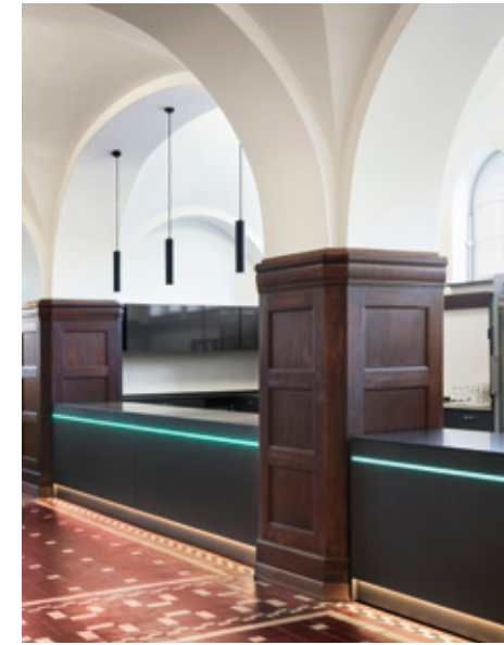
Detail Theke – mobile Thekenanlagen im Foyer