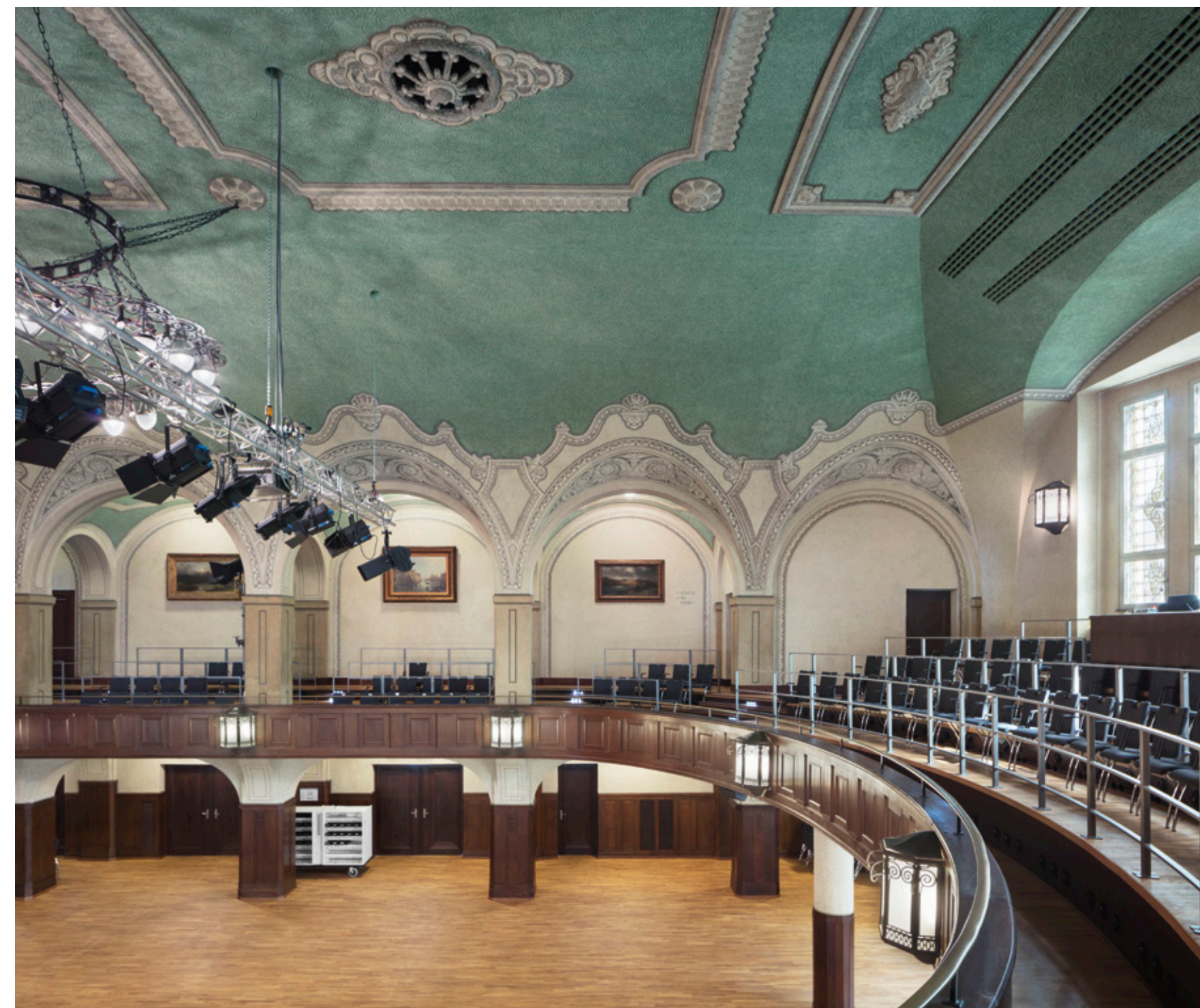
↑ Gesamtaufnahme innen

The integration of specifically designed counters for the originally restored building fabric with historic adornments as well as the development of a guidance and orientation system for the spacious and listed community centre was successfully implemented by pagelhenn.