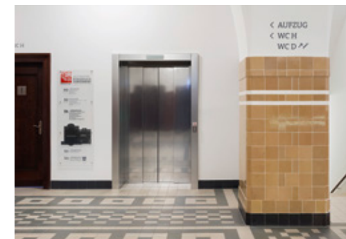
Leitsystem – Wegweiser mit Übersicht in jedem Geschoss –