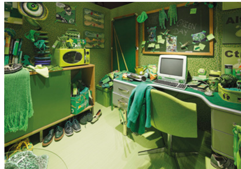
Grüner Raum – Nerd