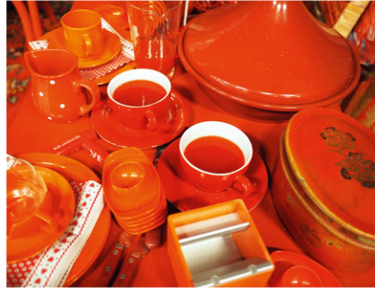
↑ Roter Raum – Fix It Girl