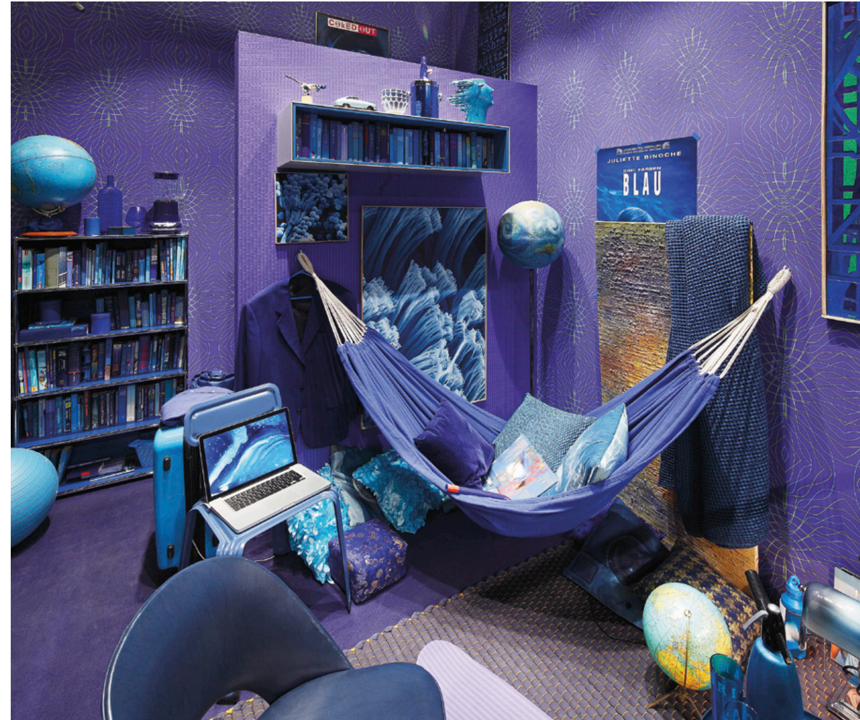
↑ Blauer Raum – Hipster

We live wallpaper! We create rooms with wallpaper where we can develop. 'Express yourself' is celebrated live at the trade fair in four colourful room sceneries with a performance lasting several days to make the achievements of wallpaper come alive.