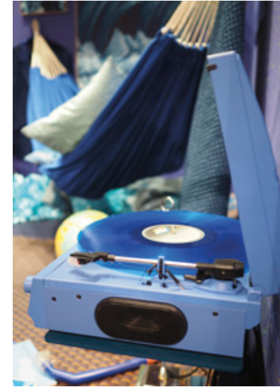
Blauer Raum – Hipster Roter Raum – Fix It Girl