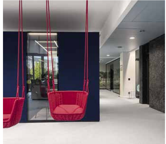
! Schaukeln mit Blick ins Büro

Local spirit meets international brand world