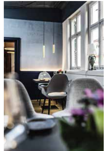
l Gemütliches Ambiente für moderne und ausdrucksstarke Küche