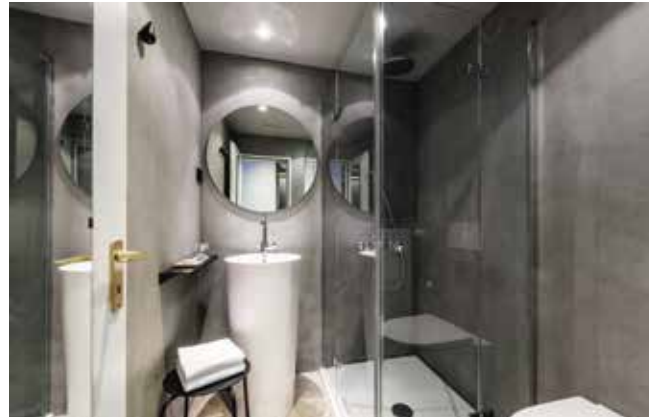
Zurückhaltende Eleganz in den Bädern