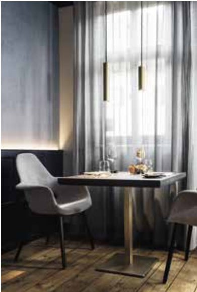
Romantische Zweisamkeit in warmer Atmosphäre