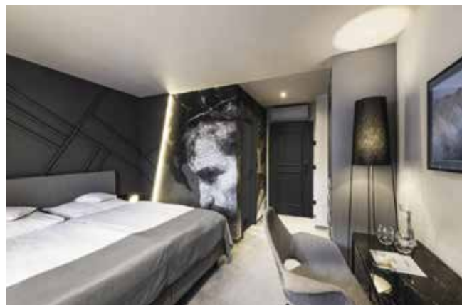
Die neuen Zimmer sind eine Hommage an die Weingeister und schlagen so eine Brücke zu dem Weingut.