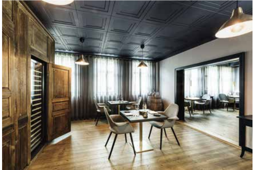
| Gastraum Weinstock