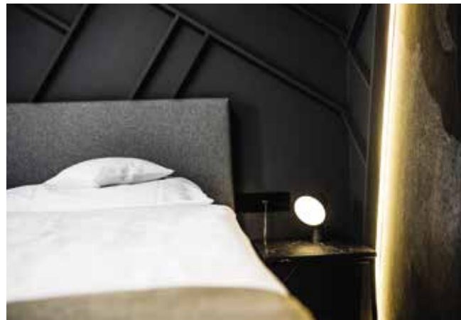
Die Wandleisten aus Holz erinnern an die Läufe in den Weinbergen.