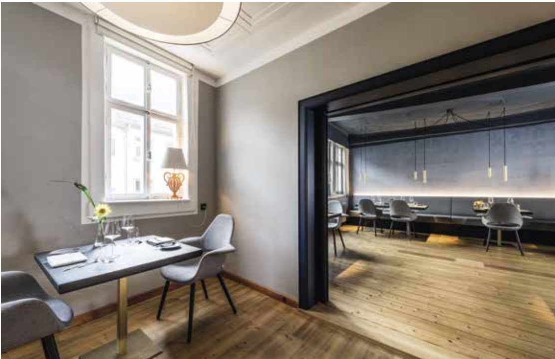
l Gaststube des Romantikhoteles Zur Schwane