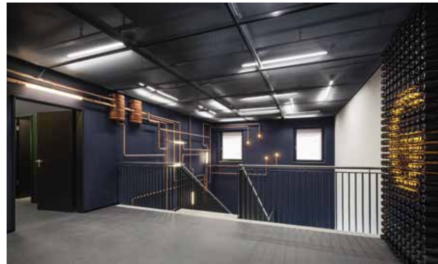
Eingang – 1. OG