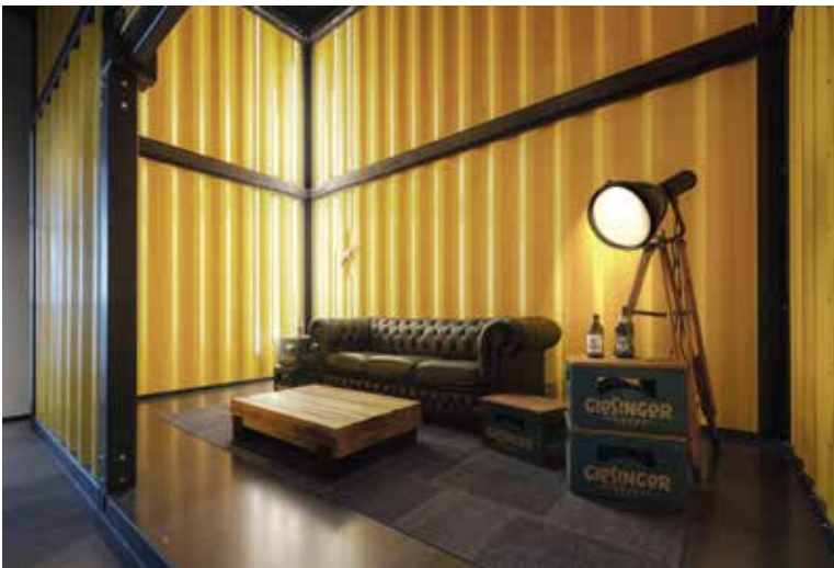
Lounge – Container-Eventhalle