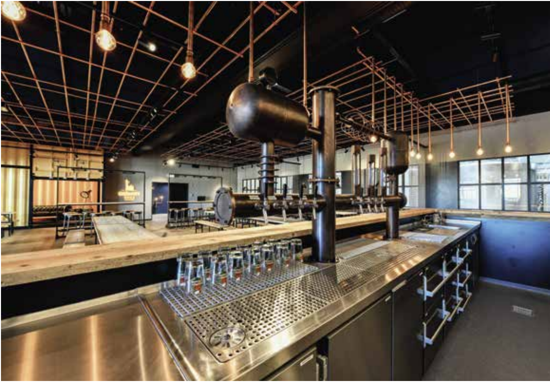
Bar – Eventhalle