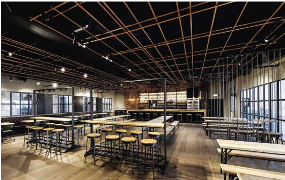
Bar – Eventhalle