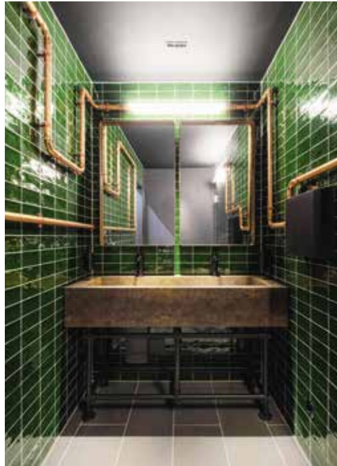
Vorraum – Gäste WC