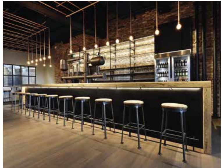
Bar – Eventhalle