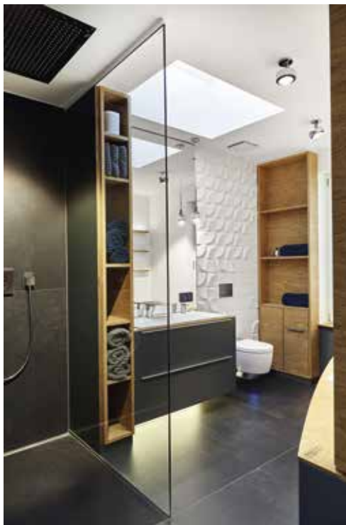
| Badezimmer mit 3D-Wandfliesen