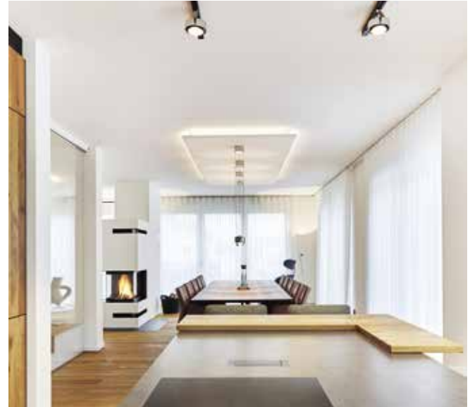
Übergang Küche zu Essbereich