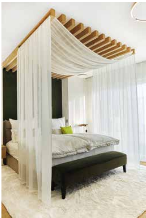
| Schlafzimmer | Modernes Himmelbett