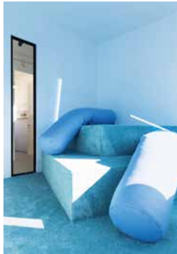
Creative Room – Crazy Coconut