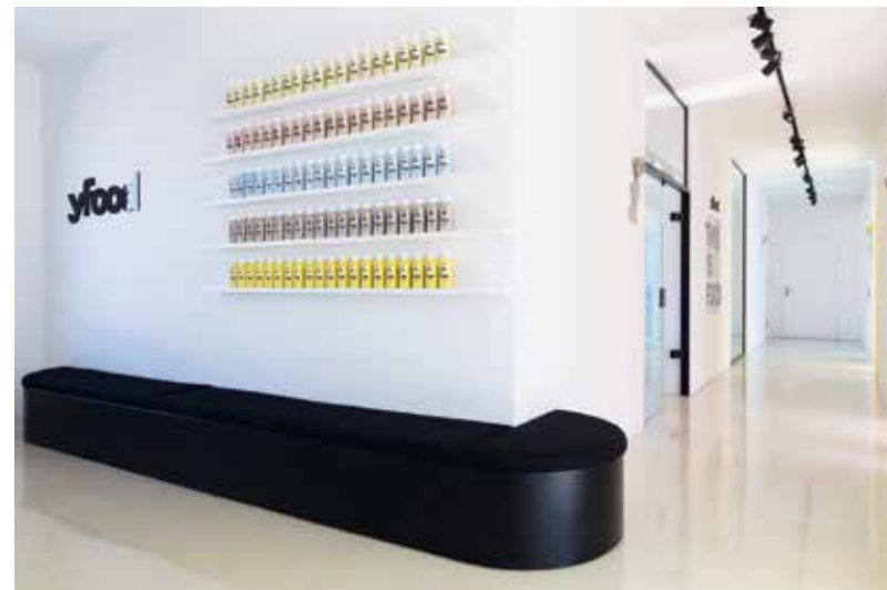
Der Eingangsbereich – klare Geometrien treffen auf Corporate Identity.