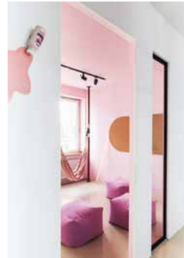
Creative Room – Fresh Berry