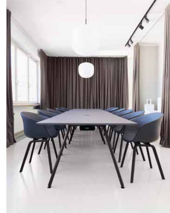
Konferenzraum – Cold Brew Coffee

Unweit der Theresienwiese in München wurde die vierte Etage des jungen Start-up-Unternehmens yfood zum visuellen Aushängeschild der neuen Marke umgebaut, die die Zukunft der Ernährung neu gestalten will. yfood zeigt nun auch in seinen Räumlichkeiten, dass hier mit großer Begeisterung Ernährung einfach anders gedacht wird – bold, smart und authentic. Die Gestaltung der Räume folgt ganz klar dem Auftrag, die Corporate Identity im Raum sicht- und erlebbar zu machen.