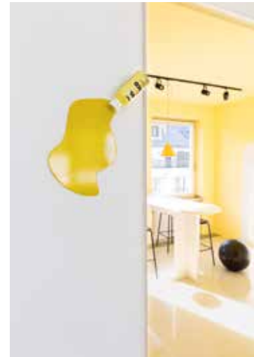
Creative Room – Happy Banana