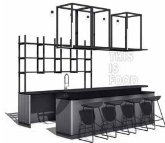
AfterWork-Bar – Visualisierung