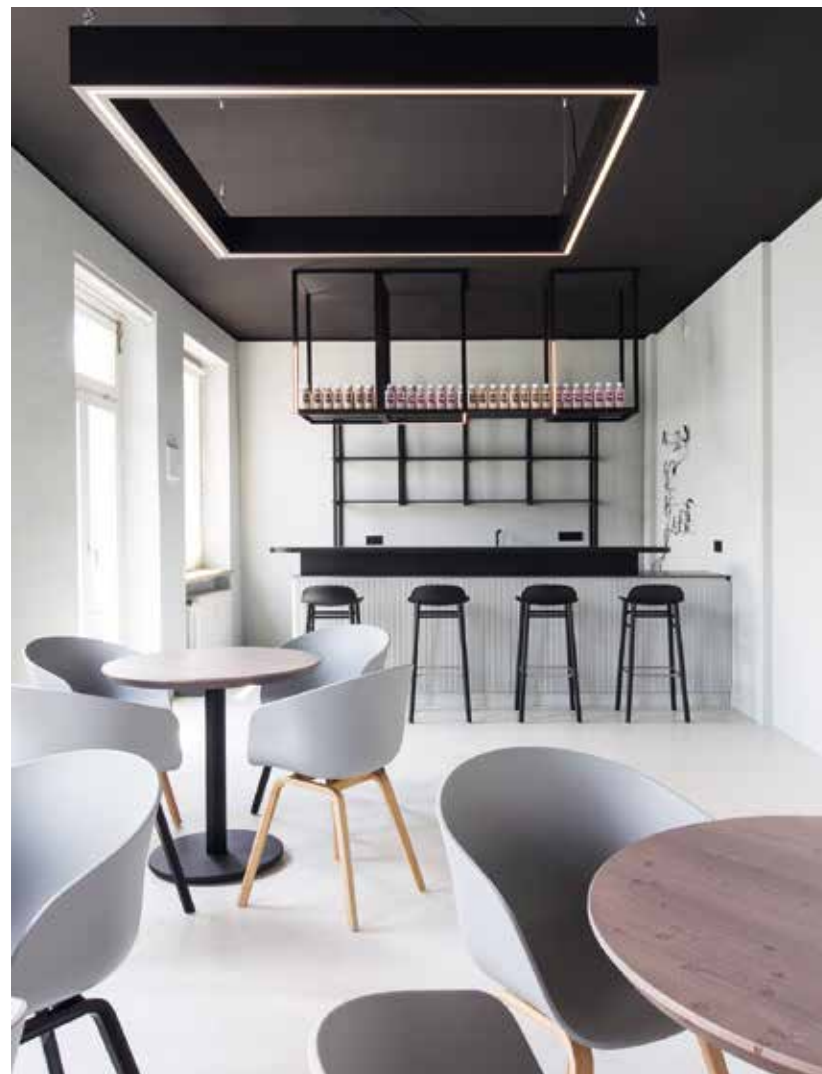
AfterWork – ein fixer Termin in Outlook