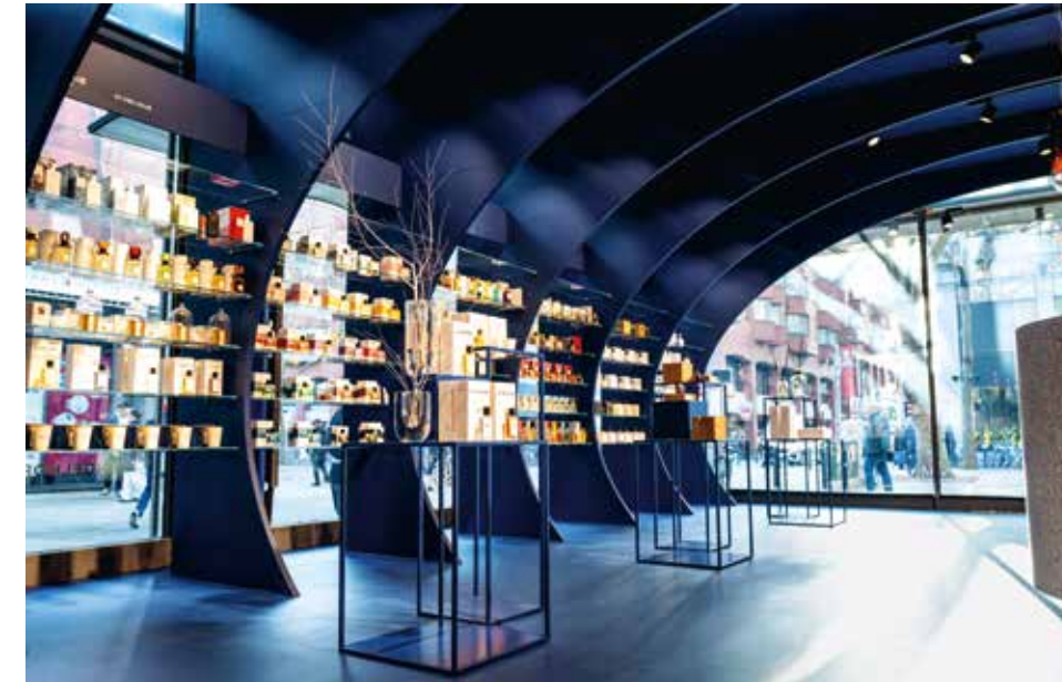
Die Ware wird zwischen den Ellipsen auf Fachböden aus Glas präsentiert.

Die einstige Fläche von Marc O'Polo, welche direkt mit zwei großen Fensterfronten in der Mannheimer Innenstadt liegt, sollte zur ersten exklusiven Parfüm- und Beautyabteilung von engelhorn Mode werden. Die Gestaltungsidee leitet sich davon ab, dass Parfüms von Königen und Pharaonen einst als Medium der Transzendenz zur göttlichen Erfahrung verwendet wurden. Dieser Gedanke steht im Mittelpunkt des Designs. Bögen mit ovalen Ausschnitten ordnen den Raum und verweisen damit auf die Darstellung transzendenter Erfahrungen im Schaffen von Künstlern wie Gustave Dorès oder Otto van Veen. Zwischen den raumgliedernden Bögen befinden sich gläserne Fachböden, auf denen die Ware ideal präsentiert werden kann. Der Raum ist in einem dunklen Blau gehalten, welches die Unsichtbarkeit von Düften unterstreicht. Ein in Terrakottafarben getönter Spiegel an der