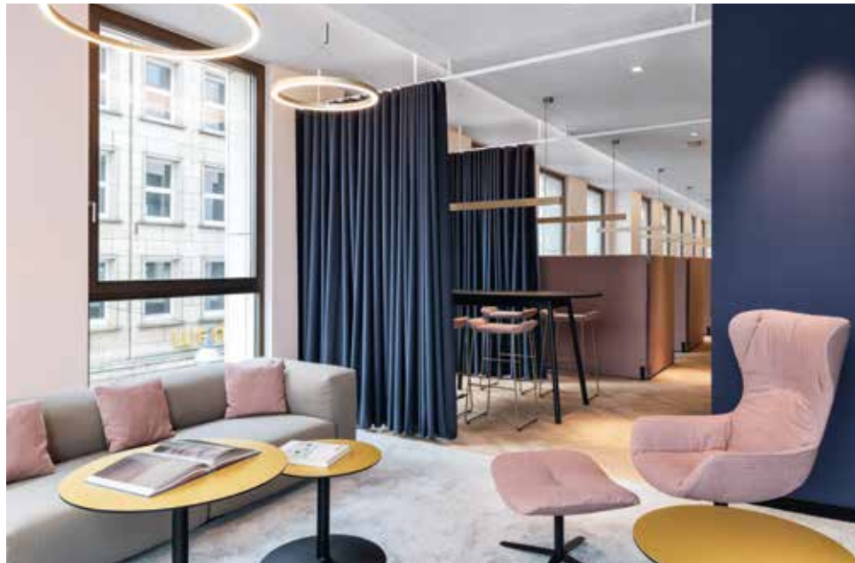
Komfortlounge mit Alsterblick