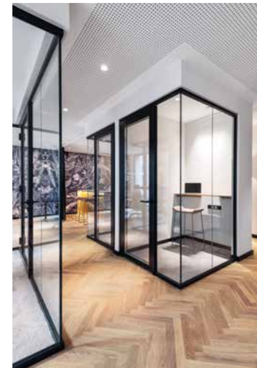
Rückzugsort Focus Room

Offene und flexibel nutzbare Zonierungen sowie multifunktionale Rückzugsmöglichkeiten stehen in Einklang mit der kompakten Mietfläche. Hochwertig ausgestattete Social-Areas fließen in die Arbeitsbereiche über und sind attraktiv mit bester Aussicht positioniert. In der Open-Space-Zone befinden sich die einzeln angeordneten Arbeitsplätze, die dank ihrer akustischen Abschirmungen für hohe Intimität und Konzentration sorgen. Es galt, ein gewisses hanseatisches Understatement und Wertebewusstsein mit einer modernen Farb-,