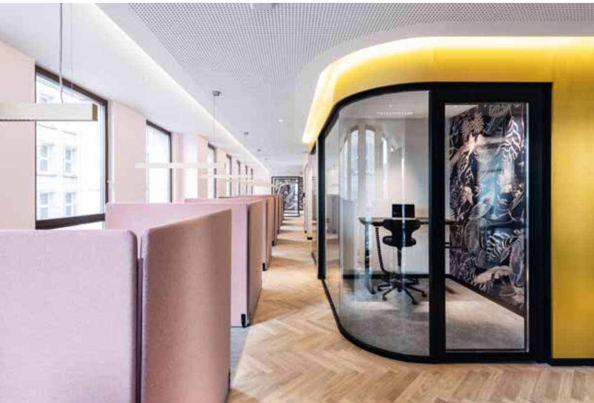
Golden Cube – prägendes Element in der Mittelzone

Multi-space in the heart of Hamburg – The high-quality materials and surfaces used in the customised office concept are harmoniously coordinated and spatial building elements are deliberately staged. An office with a homely basic atmosphere – more home than office.