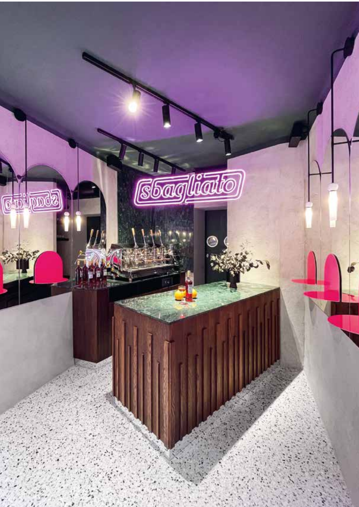
Das Herzstück – die Theke