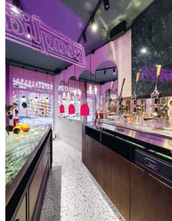
Optimale Nutzung der gegebenen Flächen