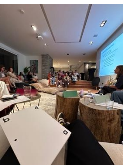
Die Landesvorstandswahl des bdia Hessen fand am 13. Oktober im Walter Knoll Brandspace in Frankfurt am Main statt.