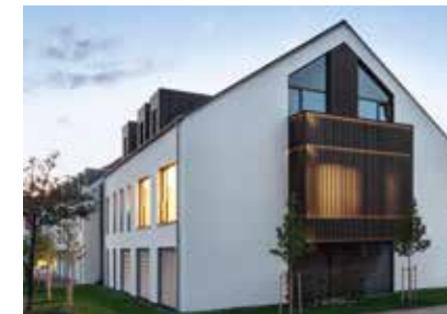
Lichtstimmung von innen nach außen

Alle relevanten Raumelemente des Tagungsortes vereinen mehrere optische, haptische sowie akustische Qualitäten. Zwei Boxen gliedern die Raumstruktur und stellen Empfang, Konferenz und Lounge in eine Blickbeziehung. Gleichzeitig sind darin diverse Nutzungen integriert: Die blaue Box strukturiert Empfang, Lounge und Küche. Ihre mit Schnitffugen und Schiebeelementen gerasterten Wände bestehen aus blaulackiertem MDF. Integriert sind darin eine optisch verschließbare Teeküche sowie die Gastküche. Die Box im schwarz-