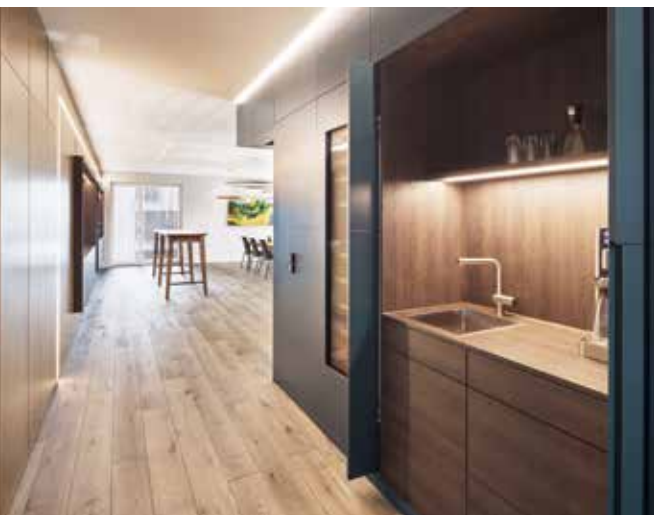
Blau lackiertes MDF mit Schiebeelementen