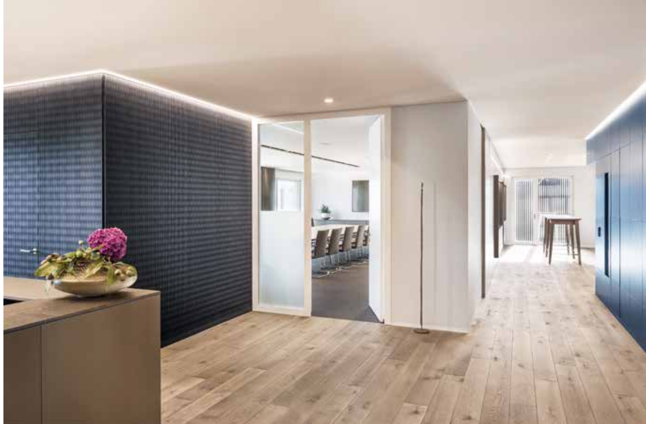
Empfang: Blickbeziehung in Haupträume