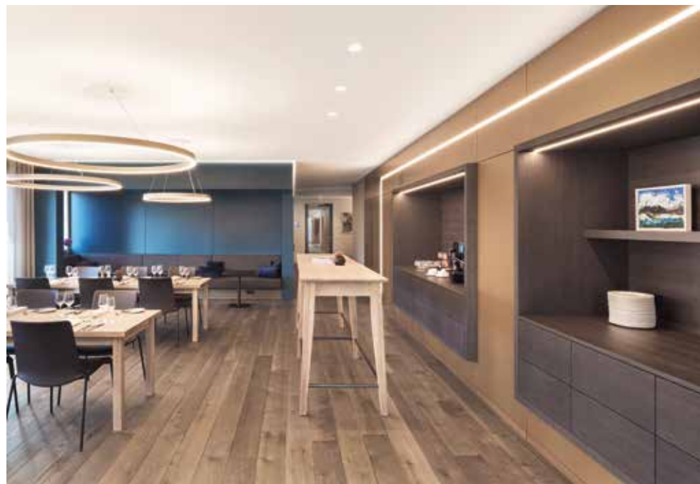
Lounge für diverse Nutzungen/Szenarien