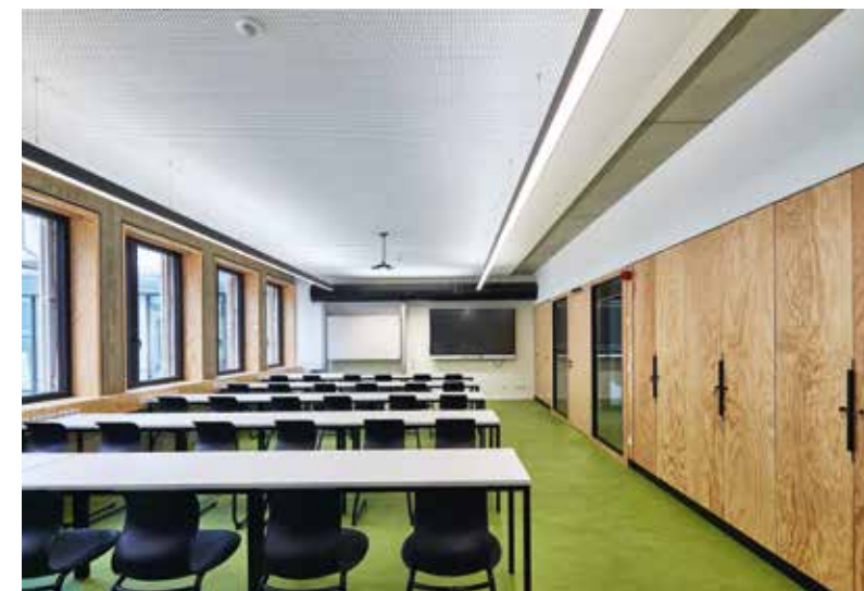
Unterrichtsraum im Lehrgebäude