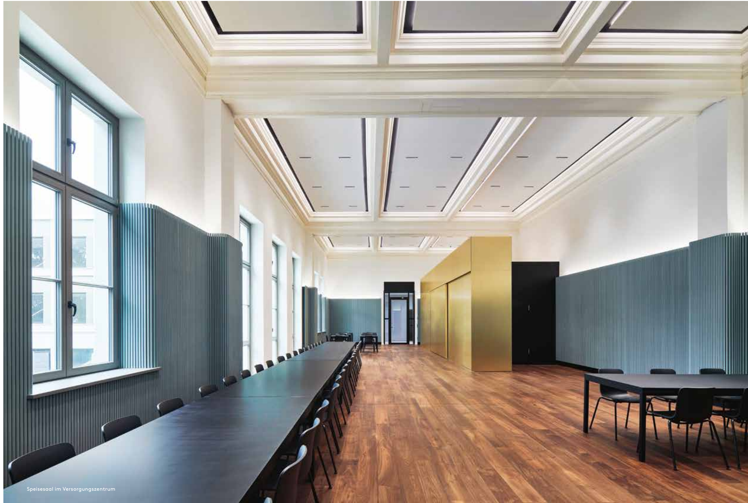
Speisesaal im Versorgungszentrum