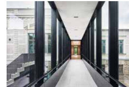
Gläserner Übergang zwischen den Gebäuden

New campus in historical setting – Having been the first tuberculosis sanatorium in Saxony and the starting point of public sanatoria, the entire former hospital complex holds great significance in terms of social and architectural history as well as landscape design. It is now used as a specialist centre for forestry training.