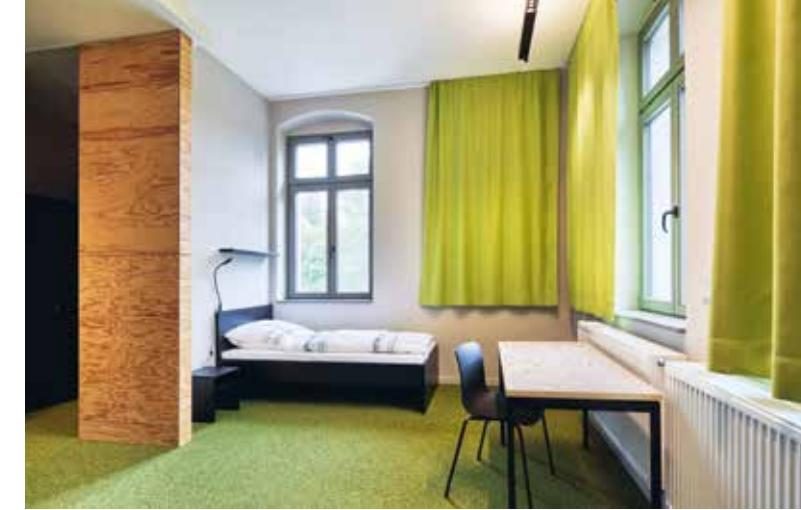
Internatszimmer im Wohnheim

saniert und im Einklang mit der Historie des Ortes mit Neubauobjekten kombiniert. Durch die Unterbringung moderner Lehr- und Fortbildungsräume, Verweil- und Sportflächen sowie einem Wohnheim entstand ein Campus direkt im Waldgebiet des Freistaates.