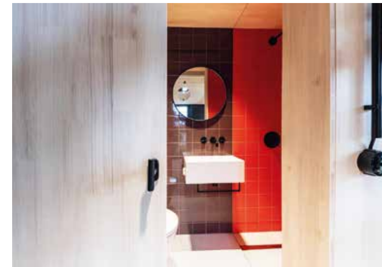
Blick ins Bad