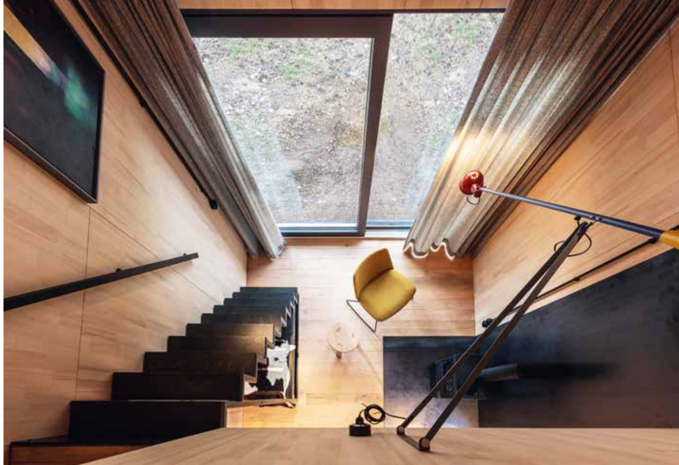
Blick vom Schlafbereich ins Erdgeschoss

In Skandinavien ist dies so üblich: Das Wohnhaus ist der Familiengröße angepasst, dafür gibt es ein kleines Nebenhaus für Gäste, welches funktional gut überlegt ist. Der Innenraum ist mit unbehandelter Weißtanne verkleidet. Die Treppe wirkt skulptural und ist puristisch ausgearbeitet. Auf der Empore ist ein gemütlicher Schlafplatz entstanden. Die hochwertige Beleuchtung schafft Atmosphäre für die unterschiedlichen Nutzungen. Das Gebäude ist an ein freistehendes Wirtschaftsgebäude in Holzmassivbauweise angebaut. Die Verkleidung mit blaugewalztem Stahl, welcher rosten darf, verleiht dem Gebäude eine besondere Ästhetik. Das Gebäude ist eingebettet in einen wunderschönen Garten.