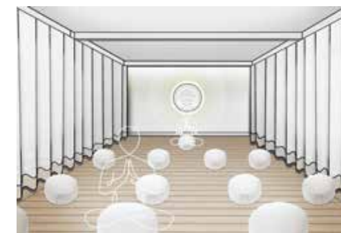
Perspektivische Darstellung Seminarraum