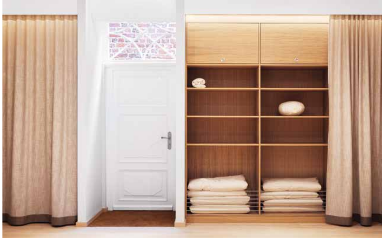
Blick hinter den Vorhang

In der Lüneburger Innenstadt haben wir für ein Meditations- und Yogastudio einen Ort der Auszeit gestaltet. Nachdem eine kleine Ladenfläche am Rande der Lüneburger Fußgängerzone in den letzten Jahren mehrfach den Betreiber wechseln musste, suchte der Eigentümer der Immobilie nach einem langfristigeren Nutzungskonzept. Durch eine vollständige Umstrukturierung des Grundrisses entstand eine auf Dienstleistungsangebote aller Art zugeschnittene Immobilie, die bei Bedarf in zwei kleinere Einheiten teilbar ist. Das Gestaltungskonzept folgt dem Leitbild des Meditations- und Yogastudios. Dies besteht darin, den Fokus vom Äußeren ins Innere zu wenden. Gäste werden von der belebten Fußgängerzone in ein kleines, ruhiges Café geleitet und gelangen von dort durch einen hellen, mystisch anmutenden Tunnel in den stillen und intimen Kursraum. Dabei wird die Material- und Farbpalette schrittweise reduziert. Details und Funktionen treten immer mehr in den Hintergrund,