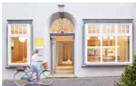
Einblick aus der Fußgängerzone

A place for taking time out – The medieval building has been transformed into a meditation studio. The concept follows the guiding principle of shifting the focus from the outside to the inside. Materials and colours are gradually reduced, functions recede and the senses become focused.