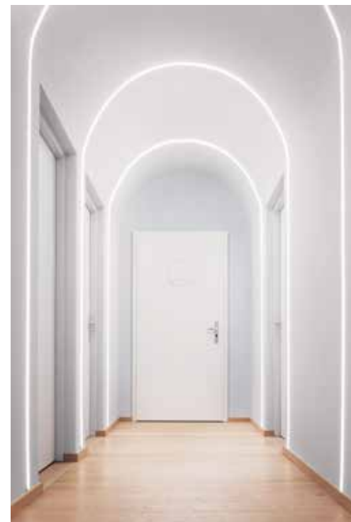
Übergang in den Seminarbereich