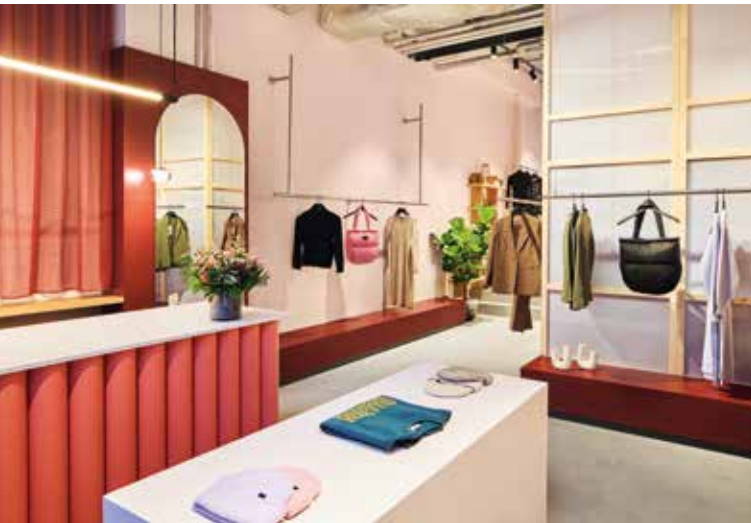
Blick Eingang Calwer Passage