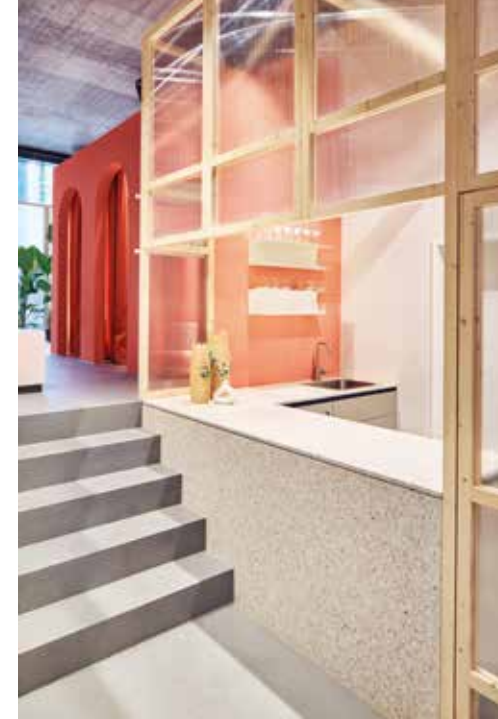
Eingestelltes Lager inklusive offener Küche