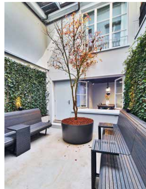
Kleiner Garten im Hinterhof

und zum Verweilen. Die alte Produktionshalle und der Verkaufsladen sollten zu einem Shop mit Verzehbereich, der alte Innenhof und frühere Durchgangsweg zu einer grünen Oase, der kleine Lagerraum als attraktiver Tiny-Meetingraum im EG und die Kombination von Sanitäranlagen/Lager/Kühlraum im UG konzipiert werden. Bei Vollenweider steht die farbenfrohe Produktpalette im Vordergrund und die außergewöhnliche, durch die Farbe Schwarz geprägte Komponente des Innendesigns. Die Verkaufstheke mit der feinen Edelstahl-Oberflächenverkleidung ist das Herzstück des Ladens. Die schwarzen Wände mit vielen gleichfarbigen Logo-Buchstaben geben dem Raum eine besondere und anschauliche Dimension. Als Farbkontrast im Verkaufsraum dient der erhaltene Bodenbelag von 1988: schwarz-weißer Marmor. Ein weiterer Höhepunkt ist das 19 m lange, kurvige Lichtobjekt, das gezielt für diesen Raum mit der Raumhöhe von 2,40 m zusätzlich zur Grundbeleuchtung angefertigt wurde. Die Kund*innen verweilen gern im Café Vollenweider mit seinem einzigartigen Design.