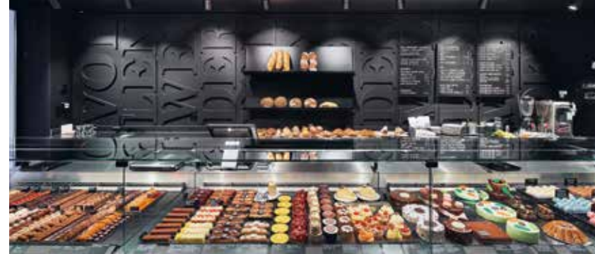
Präsentation, klein aber fein